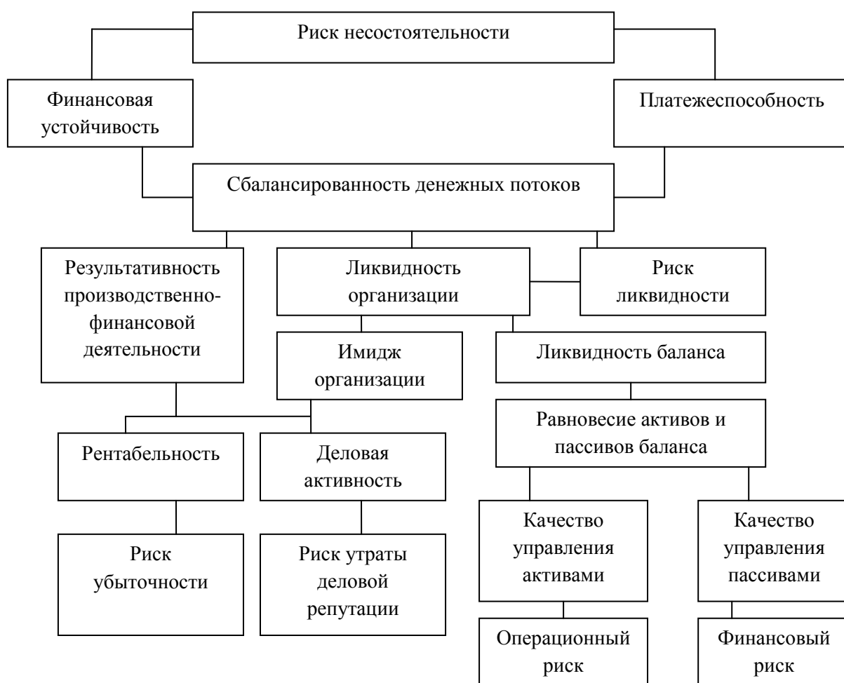
Рисунок 2 - Взаимосвязь целей и задач финансового управления

Взаимосвязь перечисленных блоков показателей можно представить в виде рисунка 2.