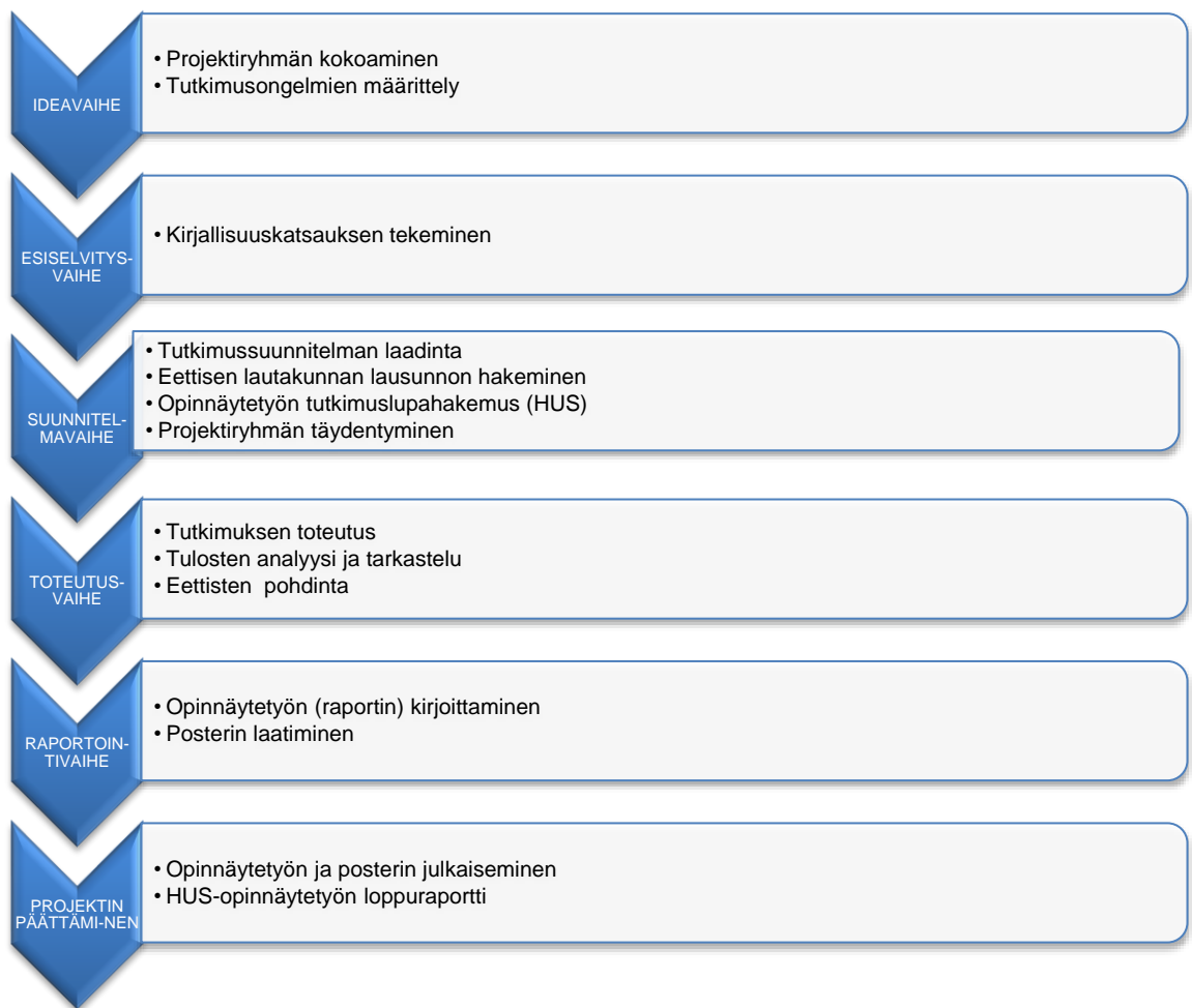
Kuvio 1. Projektin eteneminen

Projektin idea syntyi keväällä 2014 Nuorten päihdepsykiatrian poliklinikan kehittämispäivänä käydyn keskustelun pohjalta. Tällöin pohdittiin, mitä fyysiseen terveyteen liittyviä tietoja nuorista kerätään eri mittauksin tai tutkimuksin. Projektiryhmän kokoamisen jälkeen aihe ja kohde tarkentuivat sekä tutkimusongelmat määriteltiin. Esiselvitysvaihe keväällä 2014 ja 2016 kattoi kirjallisuuskatsauksen tekemisen aiheeseen liittyvästä aiemmasta tutkimuksesta ja tiedosta. Tiedonhaku, joka tehtiin ensin vuoden 2014 maaliskuun vaihteessa ja vielä täydennettiin marraskuussa 2016, on esitetty taulukossa yksi (Taulukko 1). Hauissa käytetyt englanninkieliset asiasanat oli valittu MeSH-asiasanojen rungosta. Suomeksi tutkimuksia haettiin Medic tietokannasta ja hakusanoina käytettiin FiMeSH-asiananoja. Ensin hakutulokset käytiin läpi otsikkotasolla ja tar-