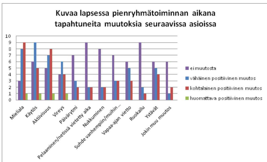
Kuvio 1 Pienryhmätoiminnan aikana tapahtuneet muutokset

Kyselylomakkeessa pyydettiin kuvaamaan lapsessa pienryhmätoiminnan aikana tapahtuneita muutoksia mielialan, käytöksen, aktiivisuuden, vireyden, päivärytmin, netissä ja pelaamisessa käytetyn ajan, nukkumisen ja suhteiden vanhempien ja muiden läheisten kanssa sekä ystävyysuhteiden, vapaa-ajan vieton, ruokailun ja jonkin muun vaihtoehdon kautta.