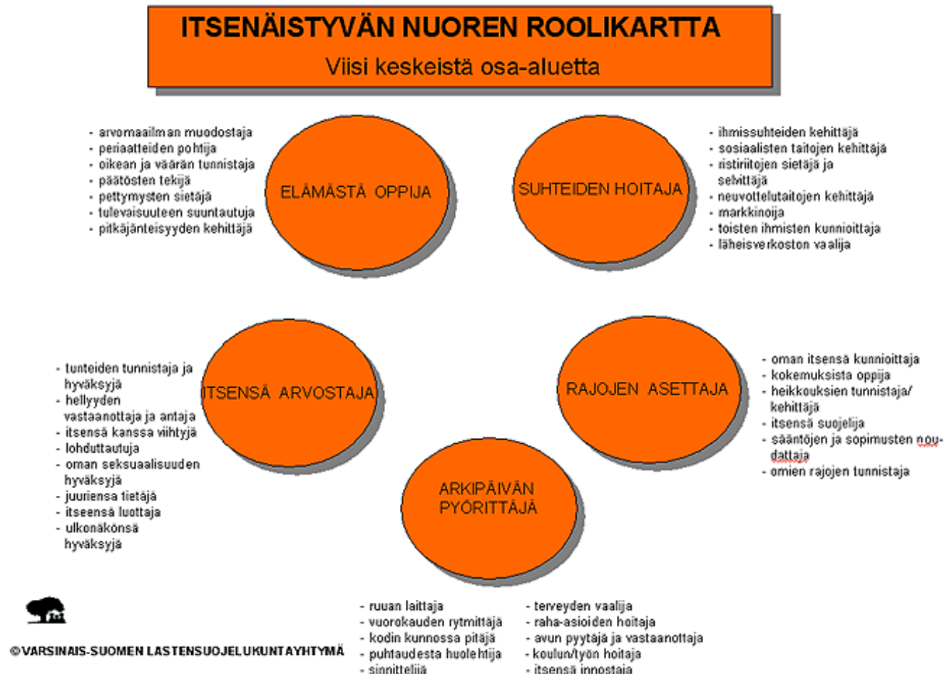
Kuvio 1. Itsenäistyvän nuoren roolikartta (Varsinais-Suomen lastensuojelukuntayhtymä 2013).

Varsinais-Suomen Lastensuojelukuntayhtymä (2013) on kehittänyt itsenäistyvän nuoren roolikartan (kuvio 1), joka voi toimia työntekijän työvälineenä itsenäistymiskasvatuksen tukena. Roolikarttaa voidaan käyttää apuna esimerkiksi lastensuojelulaitoksissa sekä jälkihuollossa. Itsenäistyvän nuoren roolikartan avulla voidaan hahmottaa nuoren valmiuksia itsenäiseen elämään sekä herättää keskustelua. (THL n.d.b.)