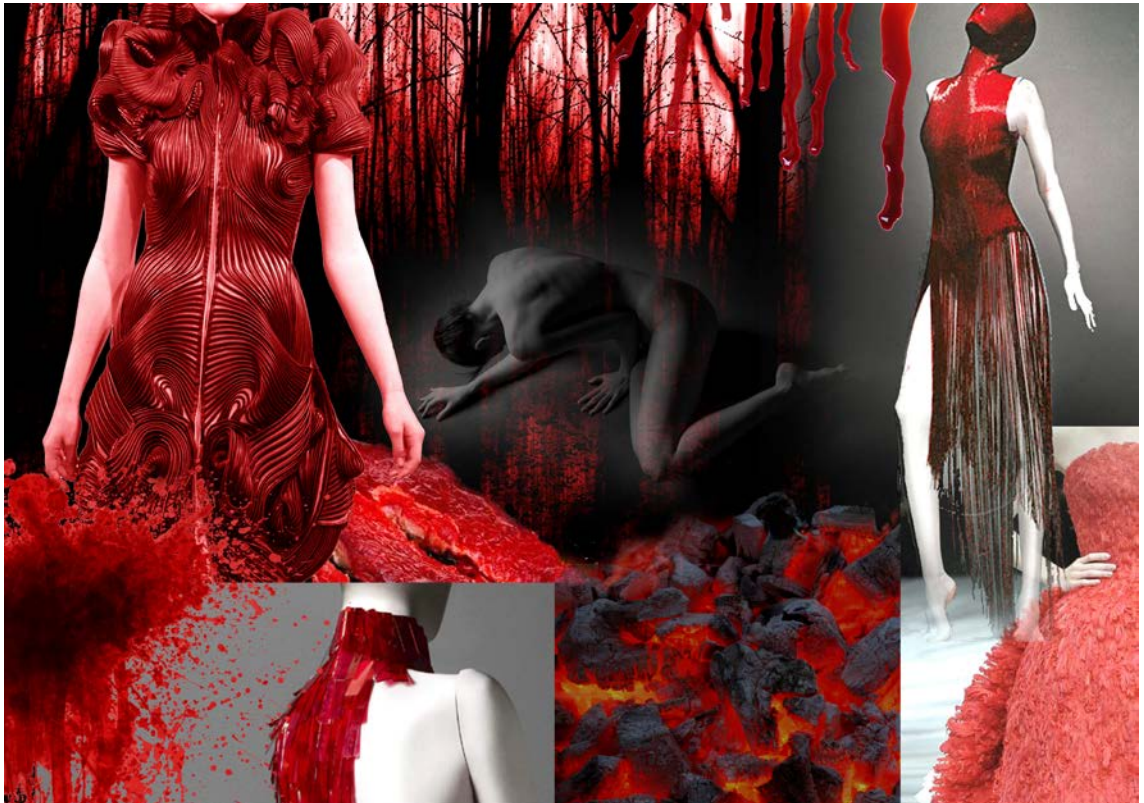
Kuva 3. Muotielokuvan punaisen puvun mood board.

Kuvassa (kuva 3) on esitettyä punaisen tuskaa ilmentävän puvun mood board. Puku edustaa kaikkea sosiaalisten kanssakäymisten aiheuttamaa tuskaa kuten esimerkiksi petetyksi tulemistä, hylkäämisen tunnetta tai tunnetta, ettei sovi yhteiskunnan ennalta määritettyihin normeihin. Tuska on sitä, kun ihminen kokee itsensä väärinymmärretyksi, kun hän ahdistuu, tai kokee olevansa täysin hukassa ja vailla suuntaa tai toivoa. Oma visuaalinen tulkintani tästä tunnetilasta on punainen veri, polttava hiili ja veresliha.