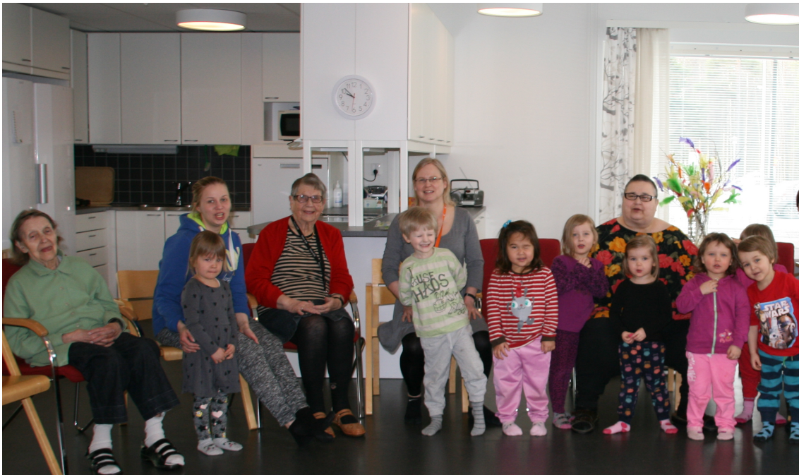
Kuva 1. Lapsia ja senioreita ensimmäisellä "Alakko nää mua?" -toimintakerralla

Jatkoimme tutustumisleikkien jälkeen muihin leikkeihin. Ensimmäisenä oli vuorossa lapsille tuttu lempileikki kommervenkka jossa arvailtiin kuka lapsista, senioreista tai muista aikuisista oli viltin alla piilossa. Seuraavaksi oli energian purkua pää-olkapää-peppu - jumppalaulun muodossa. Lapset nousivat leikin ajaksi tuoleiltansa seisomaan ja seniorit leikkivät tuoleilla istuen. Ohjauksessa näytimme mallia toinen seisomalla ja toinen istumalla. Jumppalaulun jälkeen oli vuorossa sekä lasten että senioreiden toivoma, perinteikäs laululeikki piiri pieni pyörii. Toinen meistä leikki tämän lasten kanssa piirissä tuolipiirin keskellä ja samalla toinen meistä lauloi ja taputti tahtia yhdessä senioreiden kanssa. Toiveleikin jälkeen lauloimme ja leikimme yhdessä tuoleilla istuen hämähämähäkki-laululeikin. Laululeikki oli tuttu melkein jokaiselle, mutta lauloimme sitä kuitenkin hitaasti sekä näytimme mallia, jotta kaikki pystyivät osallistumaan.