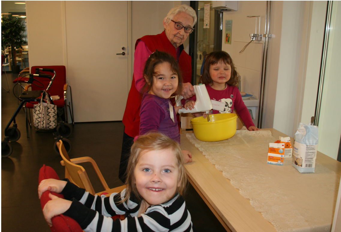
Kuva 5. Kerman vaahdotusta yhdessä

vatkaamisesta. Olimme valmistaneet pannukakkutaikinan ennen toimintatuokion alkua ajansääntämisen vuoksi ja lapset saivat juhlien valmisteluiden lomassa ihmetellä uunissa valmistuvan pannukakun taikinakuplia. Vapaamuotoisessa toiminnassa lasten ja senioreiden välinen vuorovaikutus pääsi kunnolla kukistamaan.