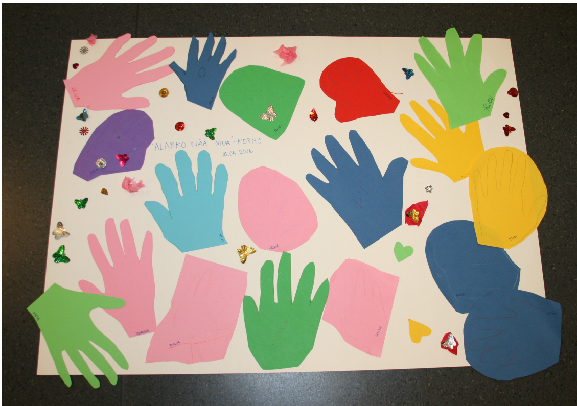
Kuva 4. Toinen tauluista muistoksi lapsille ja senioreille

lähtöisyys toteutui tällä toimintakerrallamme, kun toteutimme lapsilta saamamme askartelu toiveen.