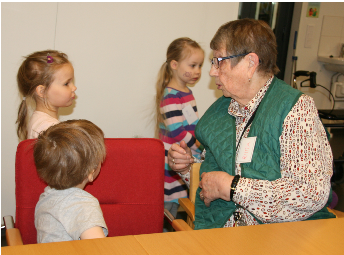
Kuva 2. Omaehtoista keskustelua lasten ja senioreiden välillä.

eräs seniori muisteli lapsuuttaan ja yksi lapsista kertoi oman tarinan lauluun liittyen. Perinnelaulun mukaan ottaminen toimintaamme kantoi hedelmää ja ikääntyneen muistelot voivat näin luoda siltaa eri sukupolvien välille (Dunderfelt 2011, 201). Edellä mainittujen asioiden myötä mielestämme kokonaistavoittemme lasten ja senioreiden vuorovaikutuksen edistymisestä toteutui tällä toimintakerralla hyvin.