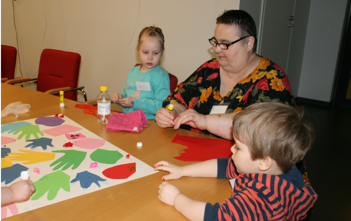
Kuva 3. Askartelua yhdessä

Sadun jälkeen kertosimme kuvataiteen kertamme tapahtumat sekä pyysimme osallistujilta palautetta tuokiostamme suullisesti ja surunaama-hymynaama -korttien avulla. Kysymykset tuokioiden jälkeen lapsille ja senioreille löytyvät liitteestä 8. Kiitimme kaikkia mukana olosta, kerroimme lyhyesti seuraavan viikon tulevasta tuokiosta, keräsimme nimilaput pois ja lauloimme tutun loppuloron. Pyysimme lapsia ja senioreita tuomaan seuraavalle toimintakerralle mukanaan oman mieleisen lelun, tärkeän esineen tai muiston lapsuudesta.