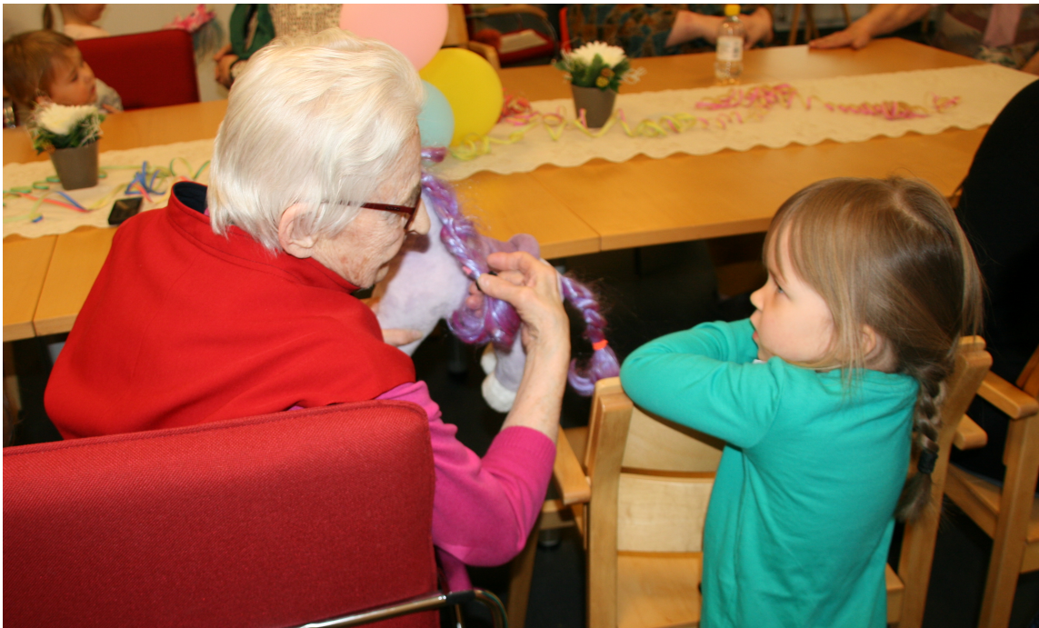
Kuva 6. Lelujen esittelyä

Toimintamme lopuksi luimme Veikko & Veikko sadun loppuun ja keskustelimme mitä ajatuksia satu herätti lapsissa ja senioreissa. Sadun jälkeen kertasimme ja palauttelimme mieleen toimintakertamme ja pyysimme osallistujilta palautetta suullisesti ja surunaama-hymynaama korttien avulla. Kysymykset tuokioiden jälkeen lapsille ja senioreille löytyvät liitteestä 8. Kiitimme kaikkia mukana olosta ja yhteisistä tuokioista ja kerroimme lapsille näkevämme heidät vielä seuraavalla viikolla. Keräsimme lisäksi nimilaput pois ja lauloimme loppuloron. Tämän jälkeen lapset lähtivät ja pyysimme senioreita jäämään vielä hetkeksi yhteiseen palautekeskusteluun.