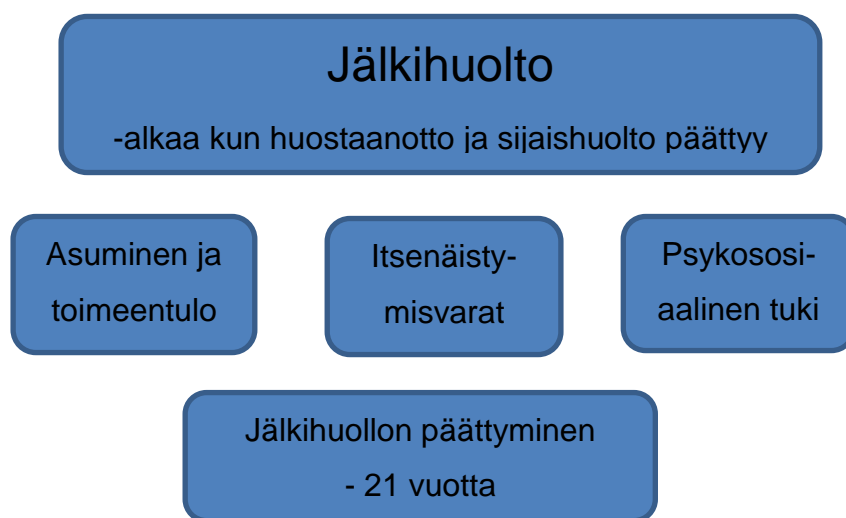
Kuvio 2. Jälkihuolto

Edellä esitelty jälkihuolto on avattu alla (Kuvio 2) kuviona selkiyttämään jälkihuollon rakennetta.