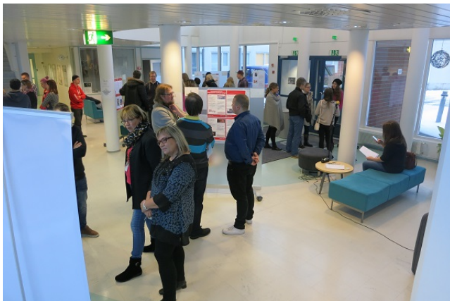
Kuva 1. Pop up Opari -tapahtuma.

Opinnäytetyöseminaarit olemme korvanneet Pop up Opari -tapahtumalla, jossa opiskelijat esittävät opinnäytetyönsä suullisesti posterin avulla. Posterinäyttely on koettu hyväksi tavaksi esittää opinnäytetyöissä tehtyjä alan kehittämistuloksia, sillä se mahdollistaa mutkattoman vuorovaikutuksen tekijöiden, opiskelijoiden, ohjaajien ja toimeksiantajien välillä. Yhteiset tapaamiset luovat mahdollisuuden myös alueen toimijoiden ja yritysten verkostoitumiseen.