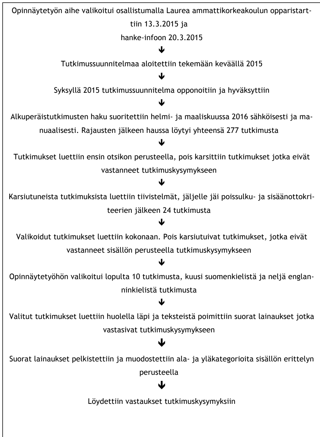
Kuvio 1. Opinnäytetyöprosessin eteneminen