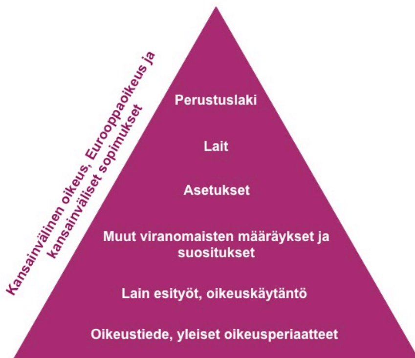
Kuvio 1: Suomalainen normihierarkia

Normihierarkia edistää oikeusjärjestyksen yhtenäisyyttä ja ristiriidattomuutta ennen kaikkea lainsäädännössä, kun taas oikeuslähdeoppi korostuu lainsoveltamisvaiheessa. Oikeuslähdeopin tavoitteena on ilmaista: mitkä lähteet kertovat oikeusjärjestykseen kuuluvista oikeusnormeista, millaisia oikeusvaikutuksia lähteillä on ja mikä on niiden etusijajärjestys. Oikeuslähdeopin ydintä on normiristiriitojen ratkaisun soveltamisäännöt. Lex superior derogat legi inferiori tarkoittaa, että hierarkkisesti ylempi säännös syrjäyttää alemman asteisen säännöksen ristiriitatilanteessa. Lex posterior derogat legi priori kertoo, että uudempi normi syrjäyttää aiemmin säädetyt hierarkkisesti samanasteisen normin. Lex specialis derogat legi generalis määrittää, että erityissäännös syrjäyttää yleissäännöksen. Oikeuslähdeopin mukainen normiristiriitojen ratkaisu on hyvin kaavamaista, eikä säännöt luo aukotonta tapaa soveltaa oikeusnormeja. 13