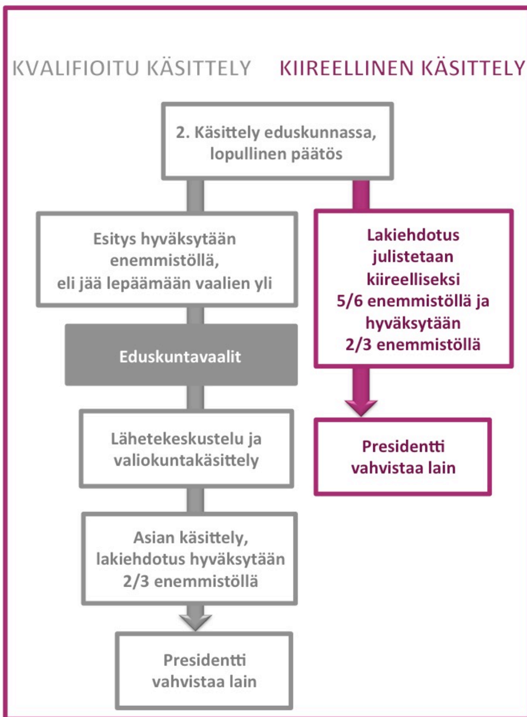
Kuvio 4: Perustuslain säädäntöprosessi eduskunnan toisesta käsittelystä alkaen