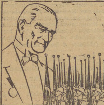
«... Bizdendi sevinci,

Ankara radyosu da millî matem dolayısıyla gece ve gündüz musiki neşriyatı yapılmıyacak ve akşam saat 19,50 de azız Atamızın Cumhuriyetin onuncu yıldönümünde halka irad ettiği hitabeyi kendi sesle neşredebektedir.