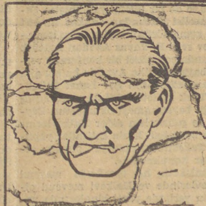
«Biz uyurduk o bizleri beklerdi,