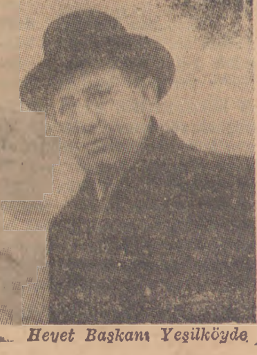
Heyet Başkanı Yeşilköyde

12 nci toplantı devresi yarın sabah 10 da Yıldız sarayında başlayacak Unesco Yönetim Kurulunun geirimizde yapacağı 12 inci toplantıya istirâk edecek olan heyet dün saat 17.30 da bir Hollanda uçağı ile Yeşilköye gelmiştir. Delegeler hususî otobüslerle doğrudan Perapalas oteline giderek Türk temsilcileri tanışmışlardır. Heyet bu sabah Atatürk'ün ölüm yıldönümü münasebetiyle âbideye çelenk koyacak, sonra vali ve belediye başkanını ve üniversiteler rektörlerini ziyaretecektir. Delegasyonun bu ziyaretleri Perapalas otelinde 1- (Devamı Sa., 3; Sü., 3 de)