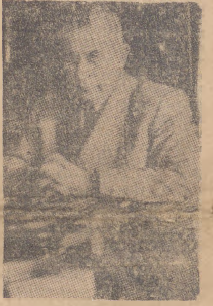
Başbakan Hasan Saka

Ankara: 9 (Telefonla) — Büyük Millet Meclisi yarın kuvvetli bir ihtimalle Şükrî Saraçoğlunun başkanlığında toplanacaktır. D. P. nin geke mevzuuna aid istizah takriri reye konulacak, kabul edildiği takdirde müzakeresine geçilecek tir. Takririn Halk Partili çoğunluk tarafından da kabul edildiği anlaşılmaktadır. İstizah takriri Grupta perşembe günü konuşulacağından mevzuun Mecliste müzakeresine cuma veya pazarısal günü başlanacağı bildirilmektedir. C. H. P. Meclis Grubunun dünkü toplantısı Ankara: 9 (Telefonla) — C. H. P. Meclis Grubunun bugünkü toplantısının hayli hararet- (Devamı Sa., 3; Sü., 1 de)