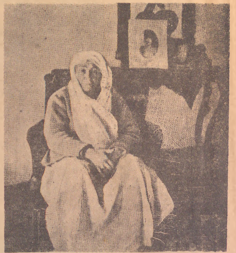
Atatürk'ün annesi Zübeyde Hanım

1880 senesinde Selânikte Mustafa adında bir çouk doğdu; Babası rüsumat memurluğunda; çökerek ticaretle meşgul olan Ali Rıza Bey, annesi Zübeyde Hanım, Mustafa henüz pek küçükken babası öldü.