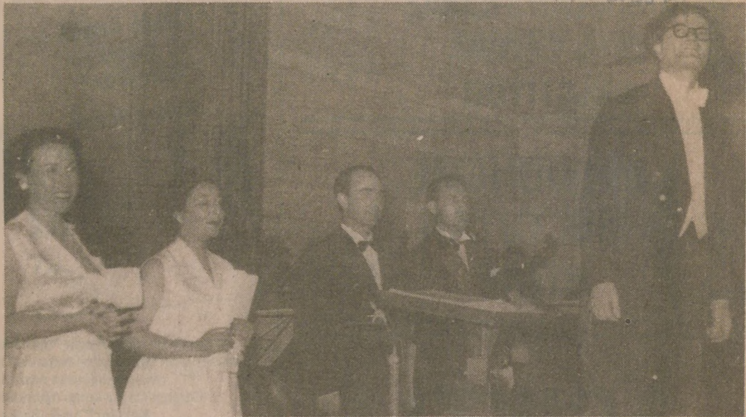
"YUNUS EMRE" ORATORYOSU — Besteci Ahmet Adnan Saygun (sağda), "Yunus Emre" oratoryosunun yıllar önceki seslendirilişlerinden birinde. Oratoryo, Yunus Emre Kültür ve Sanat Haftası kapsamında bugün İstanbul Atatürk Kültür Merkezi'nde seslendirilecek. İstanbul Devlet Opera ve Balesi Korosu'nu Hikmet Şimşek yönetecek.

Bunun nedeni Yunus Emre'nin şiirlerinin genelde dinsel bir öz içermesi ve eğitici bir nitelik taşımasıdır. Ama en önemlisi, bu şiirlerin dilinin, söyleyiş ve biçim özelliklerinin egemen şiir anlayışına ters düşmesidir. Şiiri bir tür söz oyununa indirgeyen ve soyut bir mazmunlar dünyasına kapanan Divan şairinin Yunus Emre'yi dışlaması, Türkçeye yabancılaşmasının sonucudur bir bakıma. Bu tavır, egemenliğini belli bir dinsel görüşe dayanarak sürdüren yönetici sınıfla bütünleşmeye, Yunus Emre'yi yok saymaya, giderek Yunus Emre'nin düşüncesini yok etmek istemeye yol açacaktır. Şeyhülislam Ebussuud 'un, bir zaviyede Yunus'un " Cennet cennet dedikleri / Bir ev ile birkaç huri / İsteyene ver sen anı / Bana seni gerek seni " ilahisiyle göğüslerini dövüp garip hareketler yapanlar konusunda verdiği bir fetvada cennet hakkındaki sözlerin dinsizlik olduğunu ve bunu söyleyenlerin öldürülmeleri-