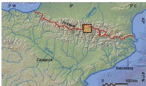
FIGURA 1. Localización del área estudiada en los Pirineos centrales.

Se han identificado mineralizaciones de sulfuros, generalmente de Zn y Pb en la cuenca del Río Garona. Las más importantes se han explotado en la zona de Liat, la Mina Victoria (Arres) y la mina Margarida (Bossòst). También se han descubierto otras mineralizaciones como sulfuros de Fe estratoligados, filones de cuarzo con calcopirita, skarns y skarnoides con scheelita y sulfuros asociados.