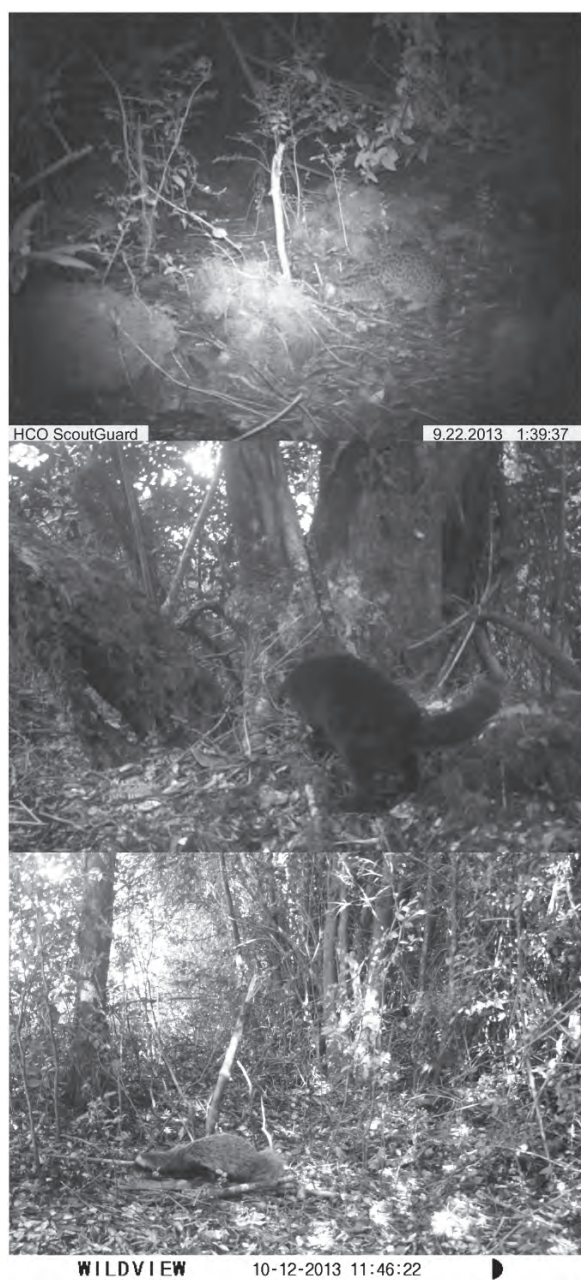
Figura 3. Imágenes de mamíferos terrestres silvestres de Huinay obtenidas mediante foto-trampeo: a) güiña ( Leopardus guigna ), b) güiña con pelaje oscuro, c) quique ( Galictis cuja ).

Destaca la rica comunidad de carnívoros de Huinay, formada por al menos siete especies diferentes, incluyendo al emblemático puma y varias especies de interés para la conservación (Tabla 1). Por ejemplo, la güiña, pequeño felino característico del bosque templado húmedo chileno (Gálvez et al. 2013), cuyo estado de conservación es Vulnerable según la UICN (Acosta & Lucherini 2008), parece ser abundante en Huinay según nuestros resultados. Por otro lado, varias de las personas encuestadas manifestaron haber visto algún visón americano en Huinay. La presencia de este carnívoro invasor en Huinay fue posteriormente confirmada por una fotografía obtenida con cámaras-trampa por los asistentes científicos (U. Pörschmann, comunicación personal). El visón americano colonizó distintas áreas del sur de Chile tras la instalación de granjas peleteras desde donde se escaparon o fueron liberados cuando su explotación económica dejó de ser rentable (Iriarte 2008). Actualmente se desconoce el efecto de este carnívoro en los depredadores nativos de Huinay, así como en sus presas principales, por lo que sería interesante su estudio, como se ha hecho en otras zonas del sur de Chile (Medina-Vogel et al. 2013).