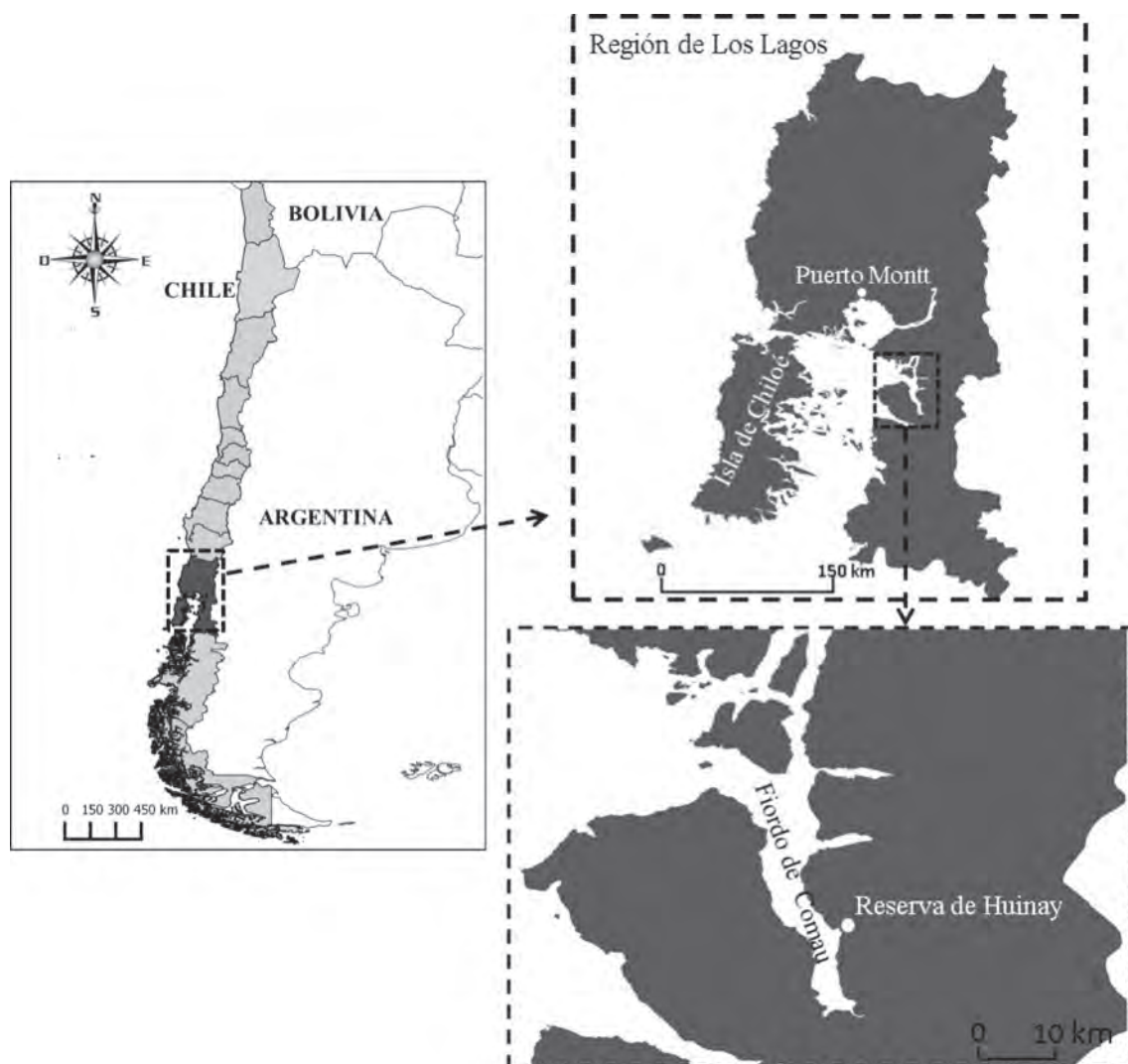
Figura 1. Localización de La Reserva de Huinay y el Fiordo de Comau en la Región de Los Lagos, sur de Chile.

En la encuesta se preguntaba en primer lugar por las especies que se habían observado en la zona, así como por el tipo (observaciones directas o indicios) y número de observaciones de las mismas (una única vez, pocas veces o muchas veces). Los pequeños mamíferos suelen ser difíciles de identificar por los entrevistados en este tipo de estudios (Ziembicky et al. 2013). Por lo tanto, dentro de este grupo sólo se tuvo en cuenta a un marsupial, el monito de monte ( Dromiciops gliroides ), por ser una especie fácil de reconocer y que está considerada como Casi Amenazada por la Unión Internacional para