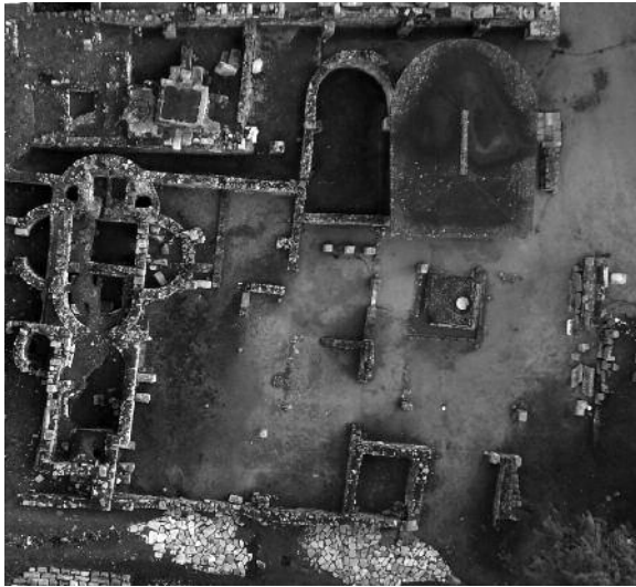
Fig. 3. Vista aérea de la vivienda IX, B. Replanteamiento de atrio a peristilo.

a unos grupos sociales cuyos réditos provienen de actividades relacionadas con el comercio, agricultura o ganadería. Mientras que la segunda estaría representada por aquellas casas articuladas alrededor de unas fórmulas que conjugan atrio y peristilo o varios peristilos puestos en comunicación, con grandes superficies útiles que desarrollan un programa donde se hace patente la preeminencia social y el status de los propietarios a través de la arquitectura y los programas decorativos.