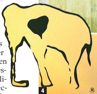
1: Escena de caza de cérvidos (Cueva de Cabra Freixet) M9-B-2 702. 2: Portada realizada por Benítez Mellado para la guía de la Caverna de Peña Candamo m9-A-2 214. 3: Cabra grabada y pintada (Cueva de Penche) M9-A-5 406. 4: Elefante en tinta china sobre papel pasta con la peculiar firma de Benítez Mellado M9-A-2 167.