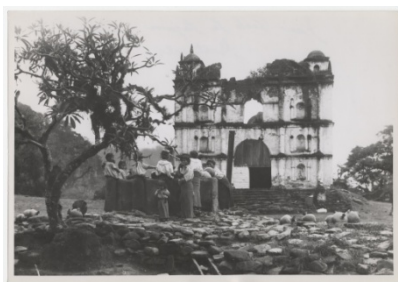
Fachada de la Iglesia de San Pablo de la Laguna, Lago Atitlan (Guatemala)