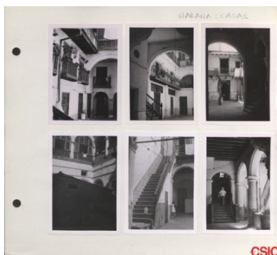
Página del álbum de Cuba (DAH32, ACCHS-CSIC)

Como fruto de sus investigaciones Angulo y Marco-Dorta, con la colaboración de Mario Buschiazzi publicaron entre los años 1945-1956 los tres volúmenes de Historia del arte hispanoamericano , obra que continúa siendo un referente en esta materia.