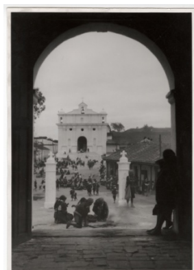
Iglesia de Santo Tomás, Chichicastenango (Guatemala). Fotografía de Eichenberger (DAH37-AH5357) (ACCHS-CSIC)

completar las series temáticas. Hay una serie de negativos de nitrato de celulosa de las fotografías realizadas por Angulo. Cabe destacar la presencia de ocho álbumes compuestos por los investigadores que están organizados por temas, países y ciudades.