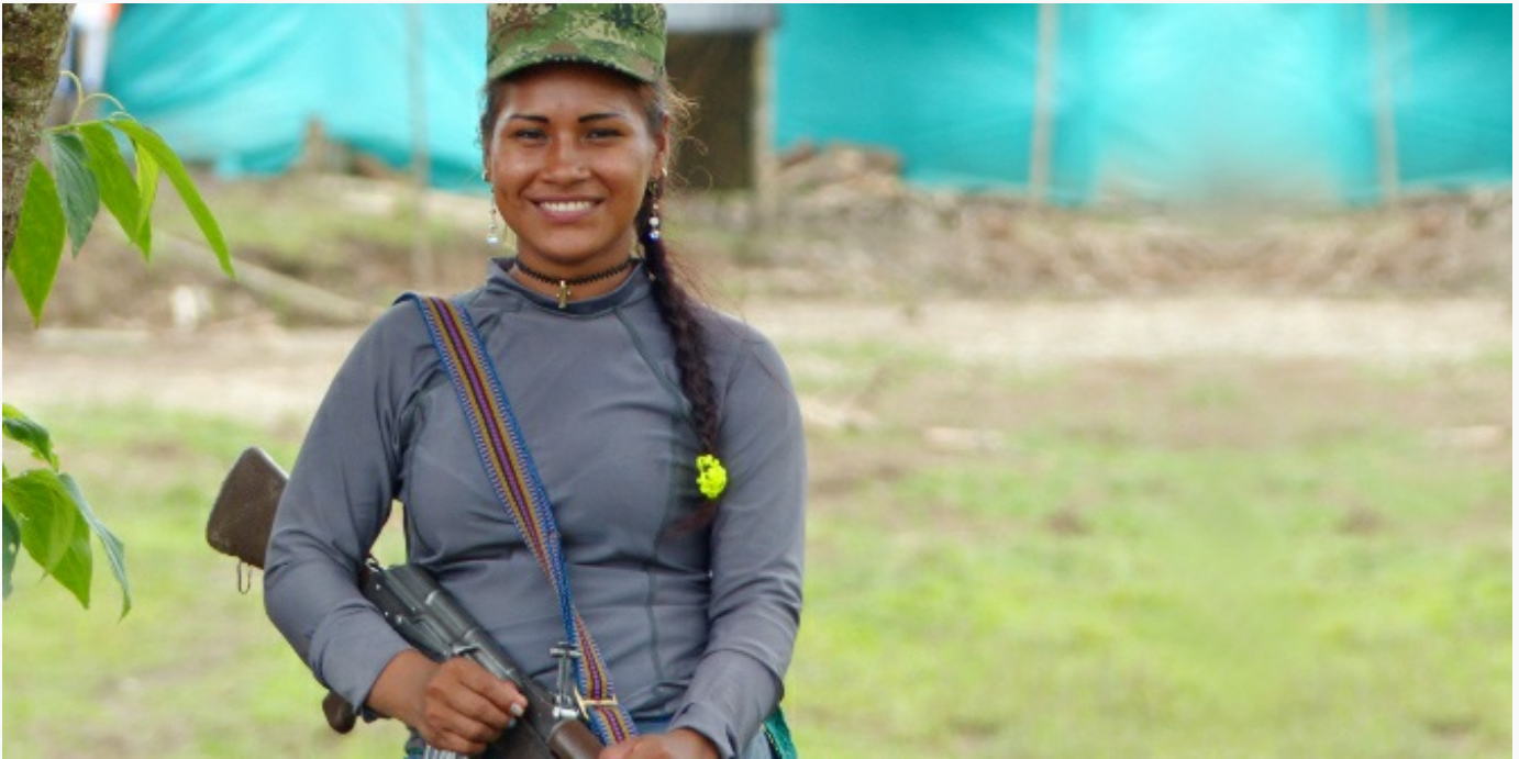
Una ex-combatiente de las FARC-EP en una zona veredal

Esa configuración de género cambió con el proceso de La Habana. Las mujeres de hecho han participado activamente en las actividades desarrolladas por la delegación de las FARC-EP, ya sea como negociadoras, asesoras, periodistas o comunicadoras. Pero es probablemente la instalación de la Sub-Comisión de Género en septiembre de 2014 lo que más ilustra la creciente importancia que se dio a las mujeres, sus realidades y propuestas en el marco de estas negociaciones.