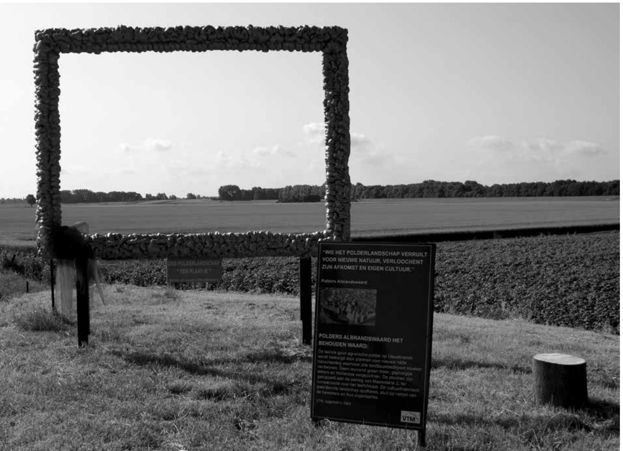
Protestbord in de polder "Ons polderlandschap – een plaatje"

Salet, W. (1996) De conditie van stedelijkheid en het vraagstuk van maatschappelijke integratie , VUGA, Den Haag