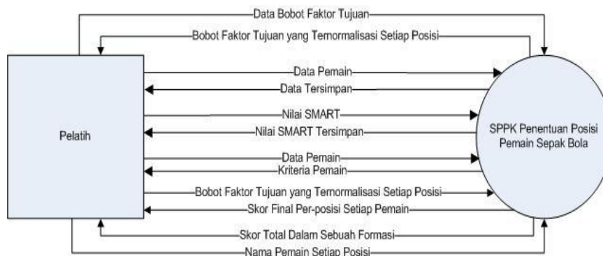
Gambar 1. Diagram konteks SPPK penentuan posisi pemain sepak bola

Dalam SPPK yang dibangun ini, dirancang 3 dari 4 komponen pokok SPPK [3] yaitu subsistem manajemen data, subsistem manajemen model, dan subsistem manajemen dialog. Komponen subsistem manajemen pengetahuan yang bersifat opsional tidak dipergunakan dalam SPPK ini. Untuk memudahkan memahami proses yang terjadi dalam sistem, dirancang pula diagram konteks dan diagram aliran data sistem ini. Gambar 1 berikut ini adalah diagram konteks dari SPPK yang dibangun.