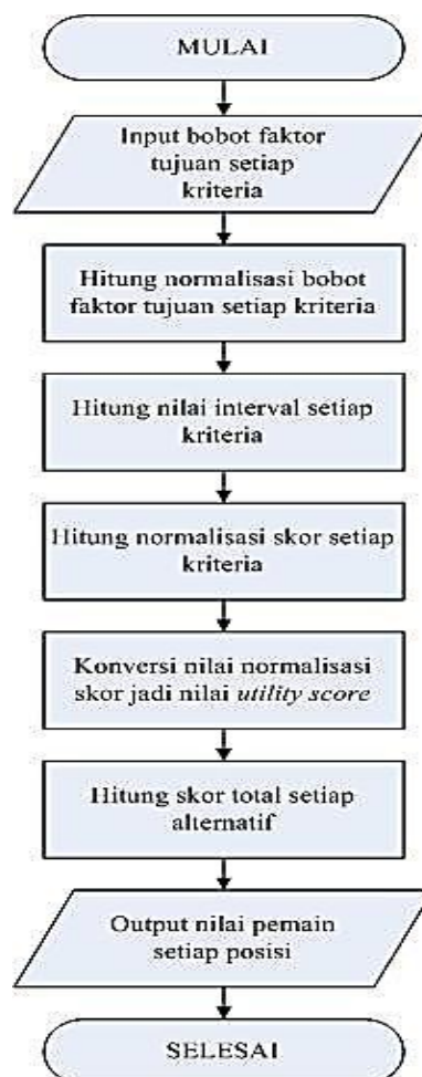
Gambar 2. Flowchart SPPK penentuan posisi pemain tim sepak bola

Gambar 2 mendeskripsikan desain subsistem manajemen model dari sistem yang dibangun dalam bentuk diagram flowchart .