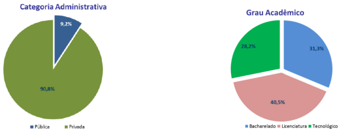
Gráfico 2 – Matrículas nos cursos de Educação a Distância por categoria administrativa