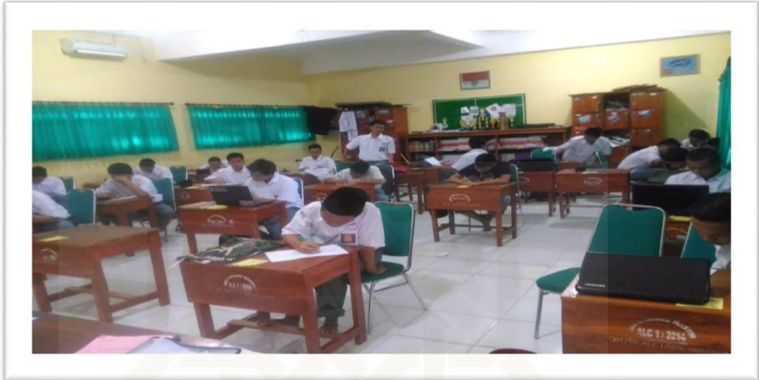
Pengisian Kuesioner Santri Putra yang Menjadi Pelajar SMA