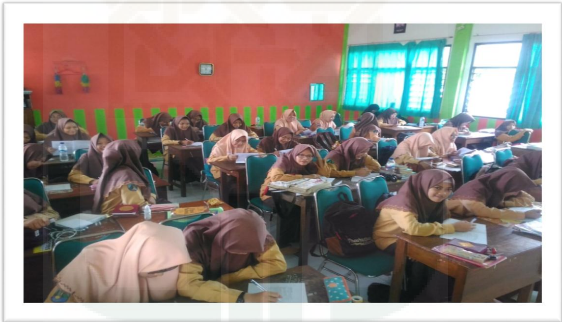
Pengisian Kuesioner Santri Putri Yang Menjadi Pelajar MA