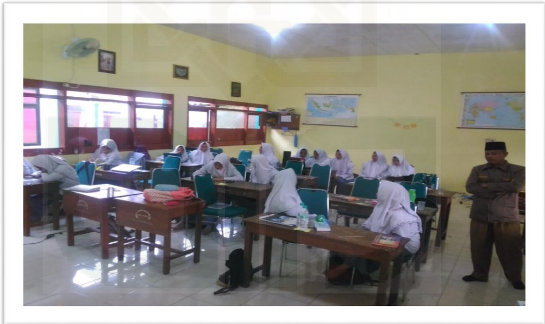
Pengisian Kuesioner Santri Putri yang Menjadi Pelajar SMA