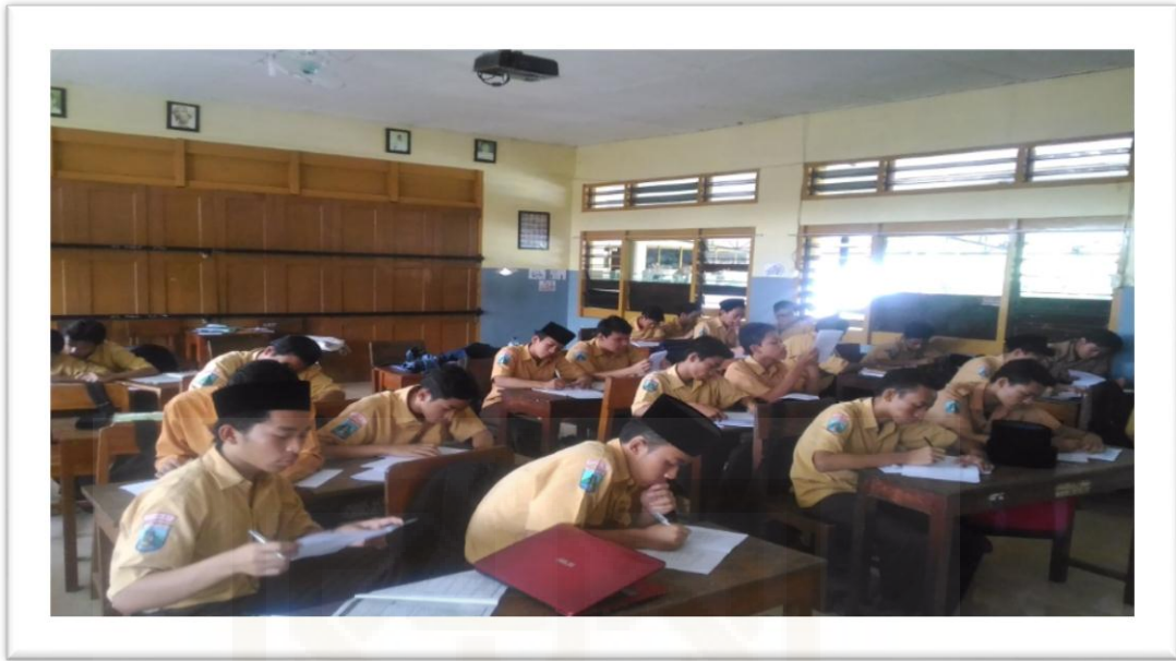
Pengisian Kuesioner Santri Putra Yang Menjadi Pelajar MA