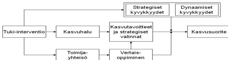
Kuva 1: Tutkimuksen teoreettinen lähtökohtamalli

Käsillä oleva tutkimusraportti on osa projektia, jossa on vuosina 2008-2012 pitkittäistutkimuksen omaisesti kerätty seurantatietoa Tekesin asiakaskunnasta muodostettuihin vertailuryhmiin kuuluvien yritysten kehityksestä ja strategisista valinnoista. Kuvio 1:ssä esitetty malli havainnollistaa tietojen keruun taustalla olevaa ajattelua. Tätä aineistoa on edelleen jalostettu ja kasvatettu vuoden 2011 ja 2012 toimenpiteiden osalta esimerkiksi lisäämällä tilastollisen aineiston osalta tarkasteluun tarkastelujaksojen uudet vertailumuuttujat. Vuonna 2011 pyrittiin nuorten innovatiivisten yritysten yrityskyselyn vastausprosenttia kohottamaan puhelinhaastatteluin. Vuoden 2012 syksyllä projektin osana toteutettiin yritystoiminnan käynnistämisen ensimmäisiin vuosiin liittyvät teemahaastattelut neljässä NIY -yrityksessä. Erillisenä projektina tutkimusryhmä toteutti 'Vigo' -yrityskiihdyttämöohjelman arvioinnin syksyllä 2012 ja sen tuottama materiaali tuodaan osaksi seurantatutkimuksen aineistoa. Arviointitutkimuksessa haastateltiin noin 40 varhaisen vaiheen yritysten parissa toimivaa henkilöä, tehtiin kirjallisuusselvitystä ja toteutettiin yrityskysely. Valtaosa Vigo ohjelman asiakasyrityksistä on myös Tekesin asiakkaita.