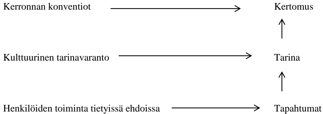
Kuvio 3: Kertomuksen, tarinan ja tapahtumien suhde (Hänninen, 2010)

tapahtumiin liittyy tunne- ja arvolatauksia, ja ne eivät ole toisistaan irrallisia. Syyseuraussuhteet on yleensä sisällytetty tarinan esittämiin tapahtumiin. (Hänninen, 2010)