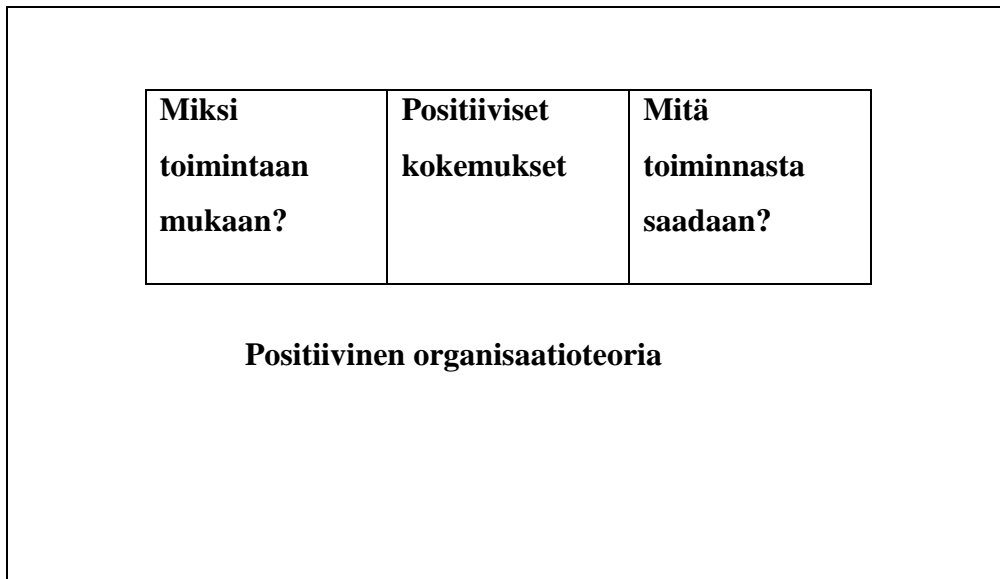
Kuvio 1: Vapaaehtoistyöntekijän polku prosessin näkökulmasta kuvattuna

Seuraavissa osioissa käsittelen tarkemmin vapaaehtoisen polun jokaista eri osa-aluetta ja positiivista organisaatioteoriaa tutkimukseni teoreettisena kontekstina.