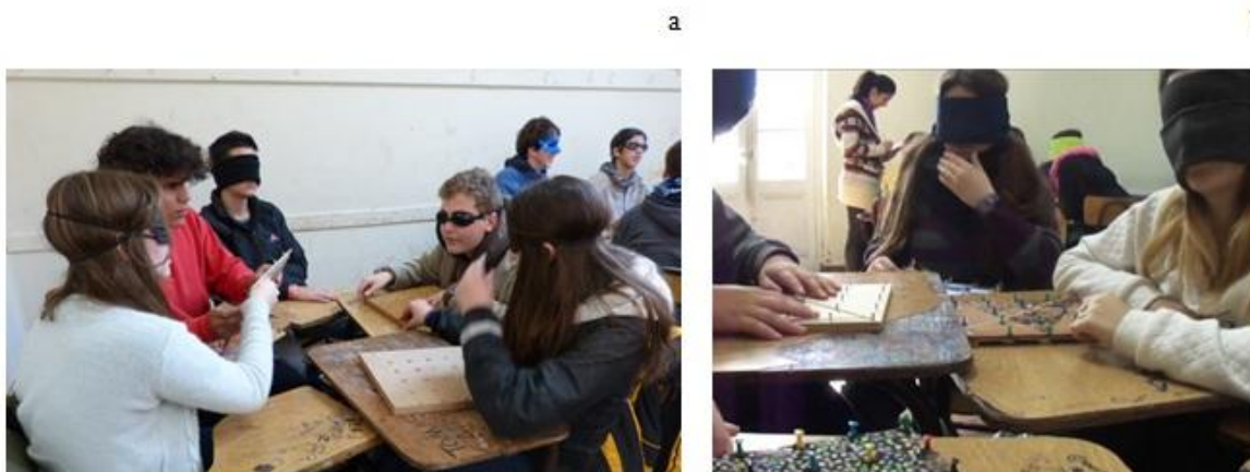
Figura 4: Trabajo en grupos. a) Intercambios; b) apoyo para el registro de ideas.

individual, en algunos grupos comenzaron a intercambiar sus producciones para compararlas y controlar que todos estuvieran hablando de la misma representación (Figura 4 a). El docente encargado de apoyar a cada grupo tomaba notas de aquello que los estudiantes consideraran necesario -alguna ecuación que ayudara a resolver, pasos de la resolución, etc.- (Figura 4 b).