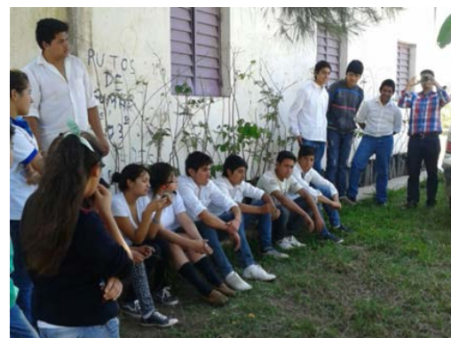
Figura 6. Clases con estudiantes secundarios.