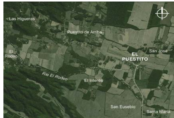
Figura 2. Vista satelital del área en estudio.