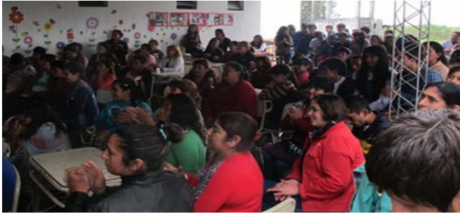
Figura 7. Reunión de padres, alumnos y docentes.