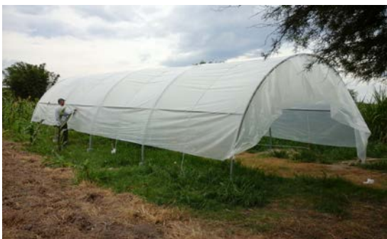
Figura 5. Promoción de huertas y viveros.