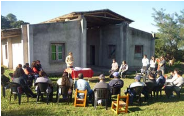
Figura 1. Reunión inicial para formular el Proyecto y designación de Comisión promotora de la Asociación de pobladores (Marzo 2014).