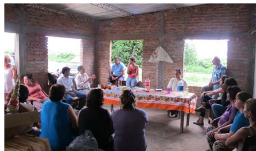
Figura 10. Reunión con pobladores y autoridades