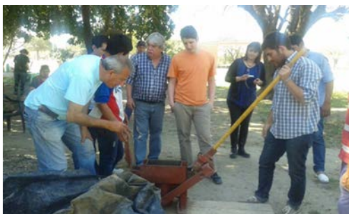
Figura 9. Capacitación con recursos naturales.