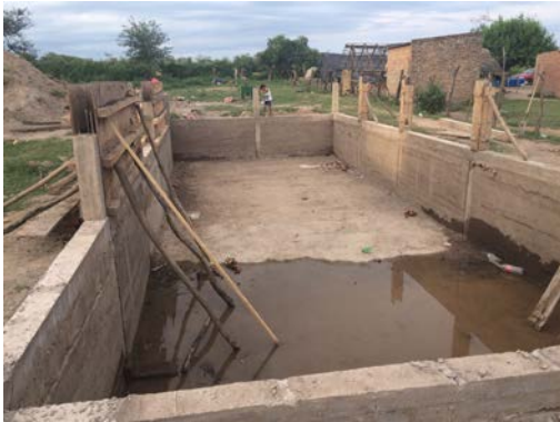
Figura 3. Cisterna en construcción.