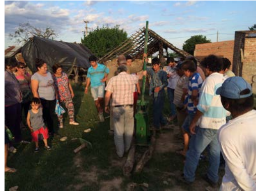
Figura 4. Capacitación en Bloques de suelo-cemento.