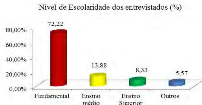
FIGURA 2. Nível de Escolaridade dos entrevistados

Verifica-se na Figura 2, que 72,22% dos entrevistados possuem o Ensino Fundamental, em sua grande maioria, incompleto. Esse dado é reflexo das dificuldades enfrentadas pelos agricultores há 20-30 anos, pois não dispunham de tempo e recursos financeiros para frequentar a escola. Geralmente as mulheres frequentavam a escola e os homens ajudavam os pais na agricultura. Resultados semelhantes foram encontrados por Vieira (2011) onde mostrou que 1,92% dos entrevistados eram analfabetos; 73,08% dos produtores tinham o ensino fundamental incompleto.