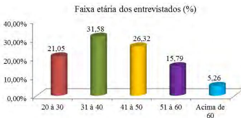
FIGURA 1. Faixa etária dos entrevistados.

Em relação à faixa etária, observa-se na figura 1 que o intervalo de 31-40 anos representa a maioria dos entrevistados, seguida pela faixa etária de 41 à 50 anos. A partir desses resultados pode-se inferir que os entrevistados fazem parte de um grupo mais experiente. Esses dados são preocupantes, pois se observa que os agricultores estão com idades relativamente avançadas e não é notória uma expressiva participação da juventude na sucessão dos trabalhos, portanto, futuramente a habitação e produção no campo pode ser muito menor do que a de hoje. Mello (2003), em suas pesquisas no estado de Santa Catarina, constatou que os filhos mais velhos, com idade entre 22 e 29 anos, são justamente os que estudaram apenas até a 4ª série do primeiro grau e, por isso, possuem poucas chances de se inserir no mercado de trabalho fora da agricultura.