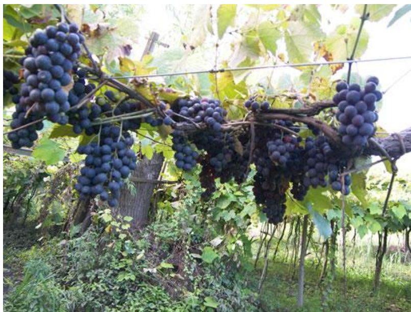
Imagen 1. Las formaciones selváticas junto a la producción de vid.

En la actualidad hallamos un mosaico de formaciones selváticas, vides, ciruelos, siendo también frecuente encontrar especies cultivadas tradicionalmente como sauces ( Salix spp ), álamos ( Populus spp ), eucaliptos ( Eucaliptus spp. ), ligustro ( Ligustrum lucidum ), y en menor medida arce ( Acer sp. ) y fresno americano ( Fraxinus pennsylvanica ). También se desarrollan cañaverales de bambúceas exóticas. Asimismo se detectan especies exóticas invasoras, tales como lirio amarillo ( Iris pseudoscorus ), ligustrina ( Ligustrum sinensis ) y acacia negra ( Gleditsia triacanthos ), sauce criollo ( Salix humboldtiana ) y el ceibo ( Erythrina crista-galli ), que conforman el paisaje 6 .