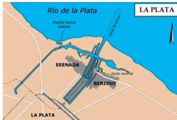
Mapa 2. Ubicación del Puerto La Plata (Nuestro Mar)

Para cumplir con los requisitos del Plan IIRSA y darle paso a los buques de alto porte, se modificaron gran parte de las características naturales de los ríos Paraguay, Paraná y de la Plata, destruyendo humedales y poniendo en riesgo ecosistemas. (Ceceña et al , 2007)