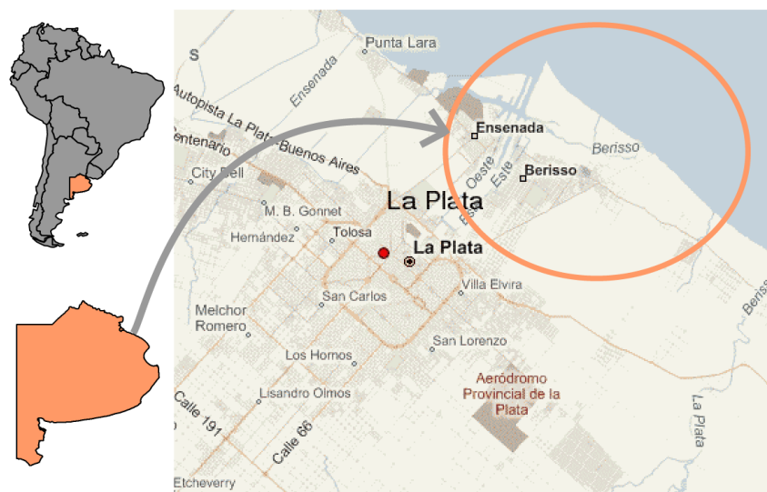
Mapa 1. Localización del Partido de Berisso (Elaboración propia)

Focalizaremos como zona de estudio la localidad de Berisso y en particular su monte ribereño, por ser este un relictos de un territorio intensamente antropizado. Tomando como fecha de inicio el año 2011, momento en el cual se pone en marcha una ampliación del PLP que perseguiría introducir mejoras en la oferta de servicios logísticos a los actuales y potenciales clientes, permitiendo tráficos de cargas de mayor porte.