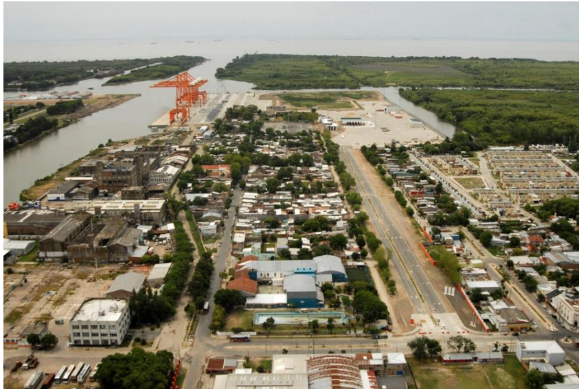
Imagen 2. Obras en el Puerto La Plata (Puerto La Plata)

desde los 28 a 34 pies (8,50 a 10,40 metros) y ampliar el canal en algunos tramos hasta los 150 metros de ancho. Además, se dispuso un área como Dársena de Giro, para la cual fue preciso ampliar el canal removiendo una porción del extremo interno de la Isla Paulino y Santiago.