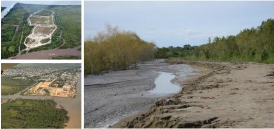
Imagen 3. A y C – Recintos de refulado sobre el monte ribereño (Asociación Nuevo Ambiente). B- Desmonte de la zona continental destinado al playón de contenedores (elaboración propia).

Los productores afectados, directa e indirectamente, junto a vecinos que habían participado en las experiencias organizativas previas, se constituyeron en la Asamblea del Monte Ribereño cuyo objetivo central fue poner en valor el patrimonio cultural y natural de la franja costera sur del Río de la Plata, reconociendo la propiedad de las tierras a los productores que la habitan y trabajan. La asamblea se fue integrando con productores de la Cooperativa del vino de la costa, la Asociación de productores familiares Isla Paulino, vecinos de Berisso y profesionales y estudiantes de la Universidad Nacional de La Plata, adquiriendo continuidad en sus reuniones.