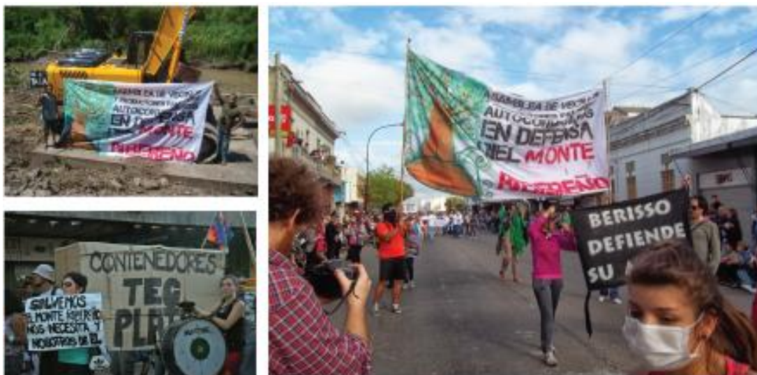
Imagen 4 - Actividades de intervención pública (Salvemos el monte)

Entre otras acciones, se ha logrado con participación de las ONGs locales la activación de una Oficina Itinerante FM, proyecto que se propone difundir historias de vida, fortaleciendo las memorias, la mediación de territorios en conflicto y el surgimiento de voces locales, para una mejora real del posicionamiento comunitario tendiente a preservar el modo de vida isleño, a herramienta para la ciudadanía consolidando su derecho a la comunicación y a la cultura sonora; como espacio autogestivo de medios de comunicación y conocimiento comunitarios, reconocido constitucionalmente en la Ley 26.522 de Servicios de Comunicación Audiovisual para la República Argentina (art.4º)