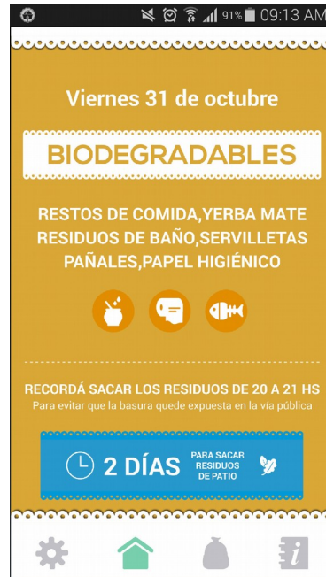
Fig. 2 – Tipos de Residuo a sacar en el día de la fecha

Por otro lado, y en una tercera pestaña, el ciudadano accede a la clasificación de residuos establecida por el municipio (Figura 3). Para una correcta diferenciación, las categorías se encuentran subdivididas por color y poseen no sólo iconos representativos, sino también, un detalle de los elementos que las componen. Así mismo se informa que día depositarlos en la vía pública; y en el caso de los residuos de patio se indica la próxima fecha de recolección de acuerdo a la ubicación seleccionada en el primer paso. Finalmente, en una última y cuarta pantalla, los ciudadanos acceden a información útil. Aquí pueden obtener los datos de contacto del R.I.M. (Respuesta Inmediata Municipal) y a una breve descripción técnica de la aplicación. La aplicación debe descargarse únicamente, y por el momento, desde Google Play. Para su utilización se debe disponer de un teléfono celular con conexión a internet (para recibir las actualizaciones) y sistema operativo Android v.2.20 o superior.