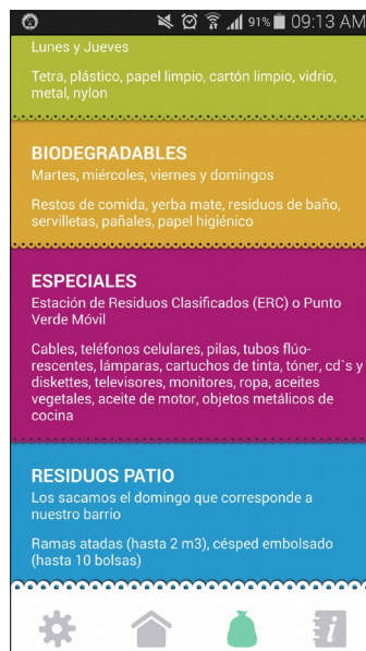
Fig. 3 – Tipos de Residuos