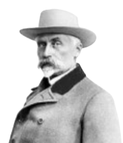
VIGGO HØRUP (1841-1902) STIFTER AF POLITIKEN I 1884

5 læserbreve og debatindlæg handlede om psykiatrien