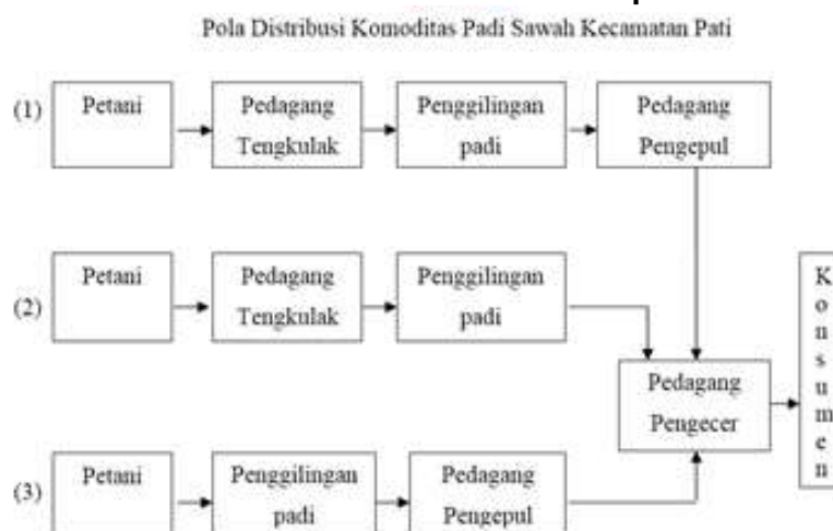
Gambar 1 Model Distribusi Padi Sawah di Kabupaten Pati

Dapat disimpulkan bahwa model bisnis petani padi saat ini tidak mendukung terjadinya model bisnis sharing economy yang dapat meng-organize, men-deliver dan meng-capture nilai lebih bagi petani, karena pola distribusi diatas merupakan skema jual beli putus yang tidak ada ikatan dalam sebuah sistem yang dapat menciptakan nilai (value creaton).