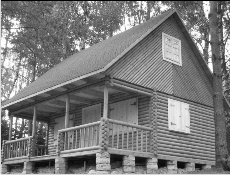
Fot. 2. Nowy dom letniskowy w Dylewie.

daje użytkownikom największy komfort psychiczny i nie psuje otoczenia (fot. 2).