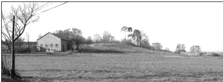
Fot. 1. Pagórek kemowy w Kolonii Górki Małe.

miesiąca, którym jest styczeń, wynosi -3,6^{\circ}\text{C} , natomiast średnia temp. najcieplejszego miesiąca, którym jest lipiec, wynosi 18,9^{\circ}\text{C} . Roczna amplituda temperatur wynosi ok. 22,5^{\circ}\text{C} (Dubaniewicz 1974). Dzięki znacznym wysokościom bezwzględny klimat jest wilgotniejszy i chłodniejszy od otaczających krain geograficznych (Woś 1996).