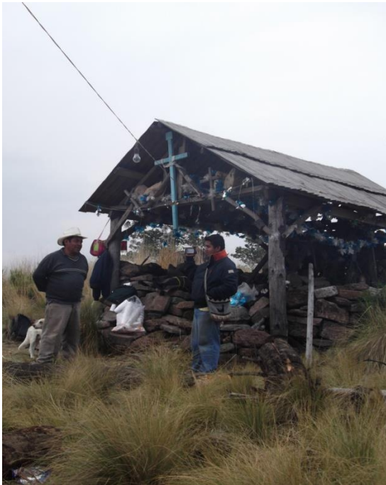
Llegada a la Cima de la Montaña de Zempoala para ver cómo se realiza el Saneamiento del Monte con comuneros de San Juan Atzingo