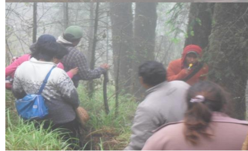
Descenso de la Cima de la Montaña de Zempoala después de realiza el Saneamiento del Monte con comuneros de San Juan Atzingo (un día de trabajo)