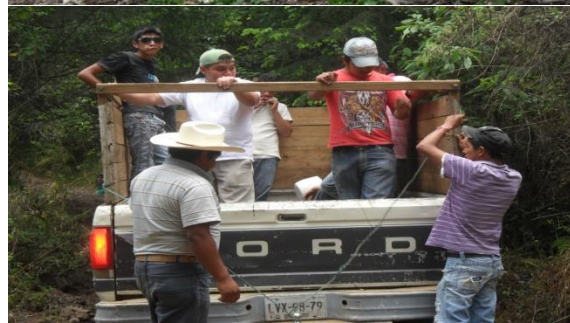
Traslado a la Cima de la Montaña de Zempoala para conocer el Saneamiento del Monte con comuneros de San Juan Atzingo