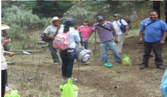
Llegada a la Cima de la Montaña de Zempoala para ver cómo se realiza el Saneamiento del Monte con comuneros de San Juan Atzingo