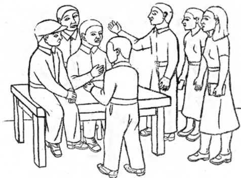
Detalle de Serie S.E.P. , Comisión Editora Popular, SEP.

En las ciudades de las que se habla hay hermosas casas y palacios, magníficas iglesias, largas y anchas calles, “cruzadas por carruajes, y gentes” (María Enriqueta, 1928a: 135), calles iluminadas en las noches; ciudades donde hay teatros, circos, cinematógrafos, paseos y música;