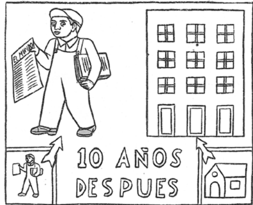
Detalle de Serie S.E.P., Comisión Editora Popular, SEP.

En Rosas de la infancia esta posibilidad de la igualdad social es más difícil de percibir, por ejemplo, en una fábula se cuenta de un burro que quiso cantar como una cigarra. El burro murió en el intento y nunca logró cantar como la cigarra. Los burros rebuznan, las cigarras cantan, no son iguales, sin embargo, “cada uno en su esfera puede lucir y valer alguna cosa” (María Enriqueta, 1928b: 64). Si bien cada ser tiene su valor, también es cierto que son distintos, por lo tanto, también deben ocupar sitios diferentes en la sociedad en la que se desenvuelven, sin querer parecerse a otro, sino reconociendo su lugar y ubicándose en él. Se trata de una sociedad estratificada, poco cambiante, desigual;