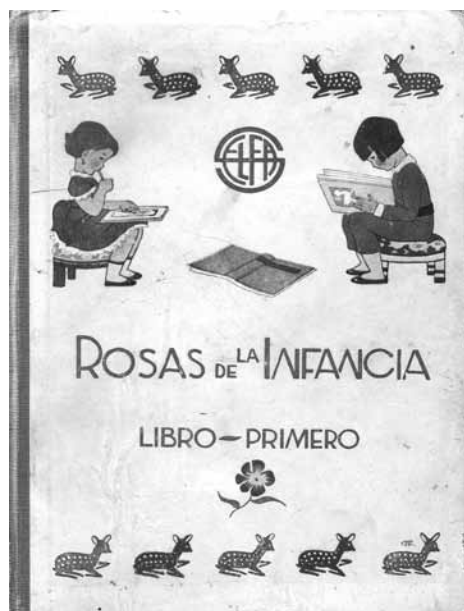
María Enriqueta, Rosas de la infancia . Lecturas para los niños. Libro primero, 1928.

parte de las lecturas son obra de María Enriqueta, se incluyen muy pocas de otros autores, especialmente algunas poesías.