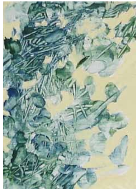
De la serie Hojitas (2011). Acrílico: Martha Delgado Ponce.