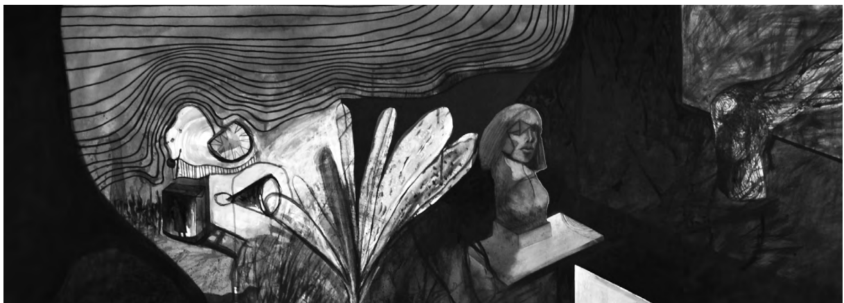
Detalle de Límites y acumulación 2 (2012). Mixta sobre tela: José Luis Vera.

En el plano de la sabiduría práctica la virtud de la prudencia es puesta a prueba. Constituye un equilibrio derivado de la comprensión y entra en escena a la hora de actuar. Para Aristóteles y Cicerón, la persona prudente es la que posee razón práctica, y por medio de ella puede deliberar de forma adecuada lo que es bueno. Así se define al hombre virtuoso y sabio. Por su parte, Carlos Díaz, siguiendo el pensamiento de Santo Tomás de Aquino, comenta: