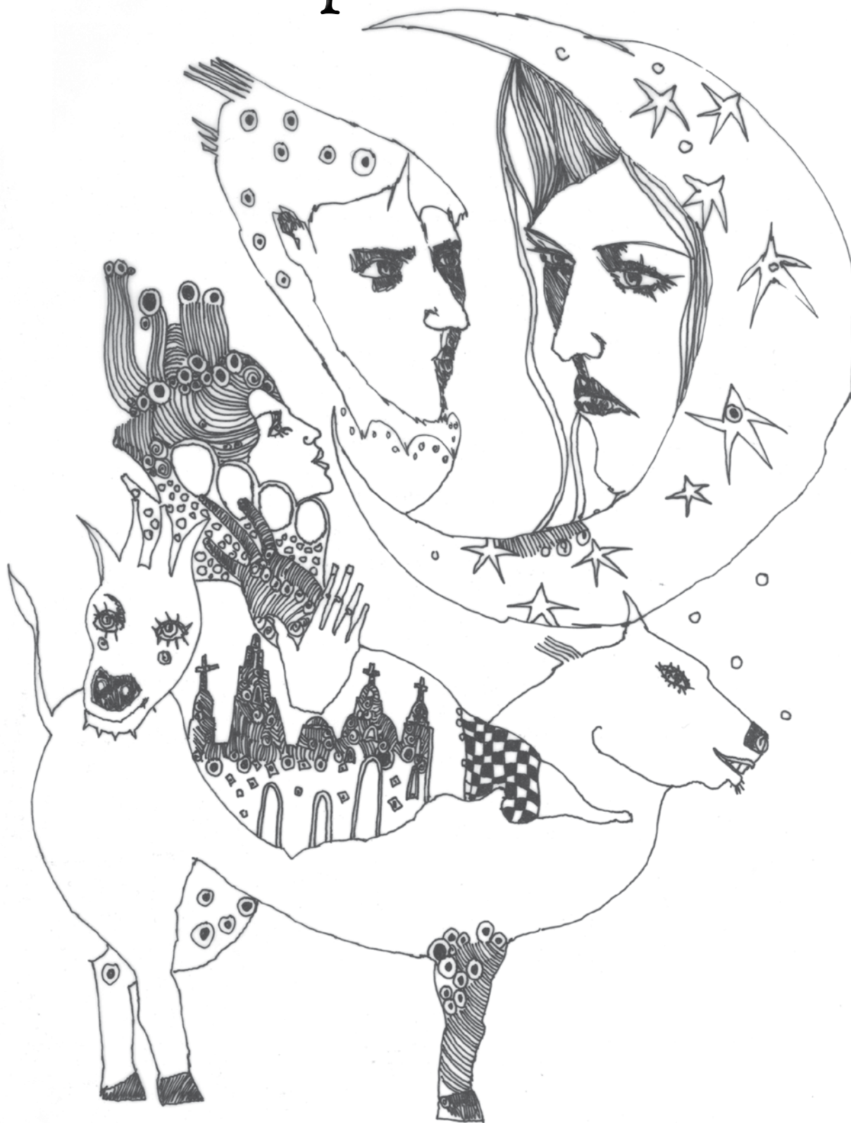
La mirada de la luna (2001). Tinta sobre papel: José Edgar Miranda-Ortiz.

LA COLUMNA 83 • julio-septiembre de 2014 • pp. 100-107 • ISSN 1405-6313