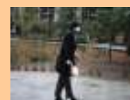
O Livro Inclinado