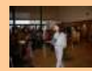
Público / Instalação