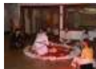
Iluminados por um Livro I

A instalação “Iluminados por um livro” , apogeu da performance que percorreu as ruas da cidade de Viseu (Portugal) e, posteriormente, celebração do dia mundial do livro, provocou profundamente centenas de utilizadores de duas instituições: a Biblioteca Municipal de Viseu e a Escola Superior de Educação do Instituto politécnico de Viseu.