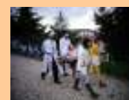
Andor da Procissão dos Livros