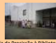
Chegada da Procissão à Biblioteca