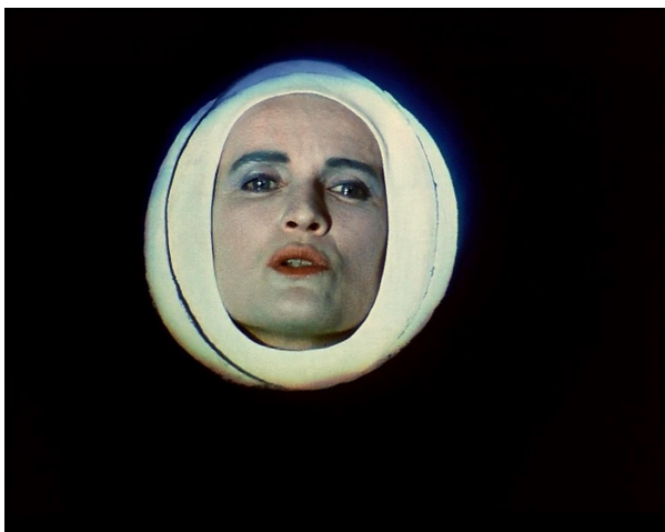
La lune dans le film Le Soulier de satin (deuxième journée, scène XIV) 60

juste la tête au travers de la toile peinte. À la fin de la prise j'ai quitté la caméra pour la féliciter, derrière le décor. Elle pleurait de tension nerveuse 59 .