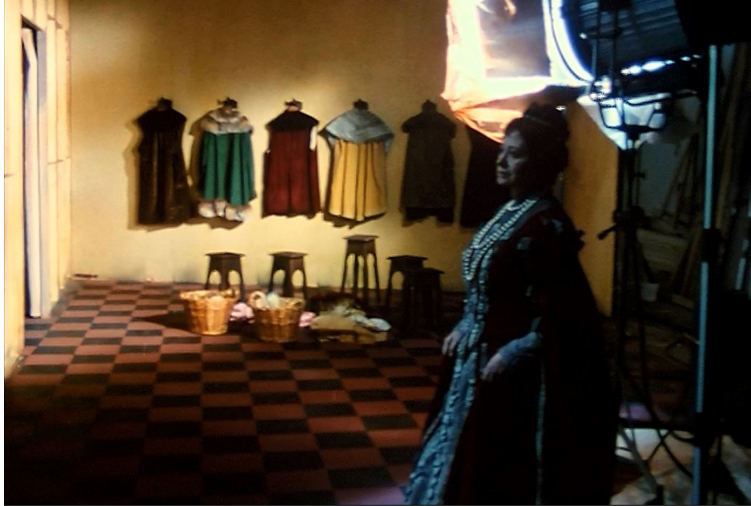
Plan du film Le Soulier de satin où l'on voit le personnage de Doña Honoria qui entre dans le champ de la caméra 47

L'avant-dernière scène composant la deuxième journée lors de laquelle se déroule l'intrigue, la scène XIII, s'intitule « L'ombre double ». Elle correspond à un épisode essentiel, pour ne pas dire central, qui pourrait servir de clé pour interpréter l'ensemble de la pièce. Une didascalie y mentionne simplement, à propos de la forme qui devrait apparaître dans la pièce, qu'il s'agit de « l'ombre double d'un homme avec une femme que l'on voit projetée sur un écran au fond de la scène 48 ». Lors de cet épisode, qui survient dans la seconde partie du film, Oliveira remplace l'image projetée, que l'on retrouvait sur scène, par des ombres chinoises. D'après le contour des costumes, des corps et des visages, le spectateur peut reconnaître en elles les silhouettes de Rodrigue et de Doña Prouhèze. D'abord placées côte à côte, puis face à face, ces ombres finissent par se fondre en un mouvement qui accompagne visuellement le texte de Claudel :