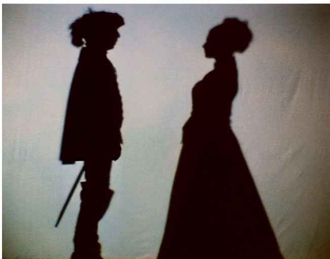
L'ombre double dans le film Le Soulier de satin (deuxième journée, scène XIII) 50