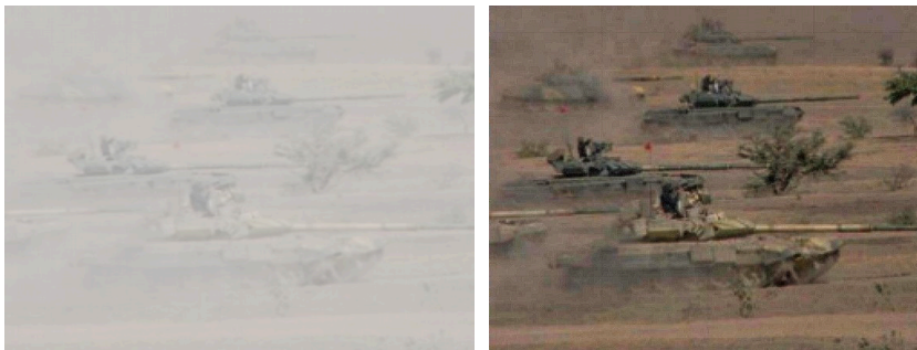
Рис. 1. Зображення до зміни параметрів якості Рис. 2. Зображення після зміни параметрів якості ужитком

рівнозначними. Застосовуючи правило підсумовування контрастів, обчислюють набір величин, які визначають сприйняття кожної пари елементів зображення. Проводячи усереднення матриці локальних контрастів, отримують сумарний контраст [2].