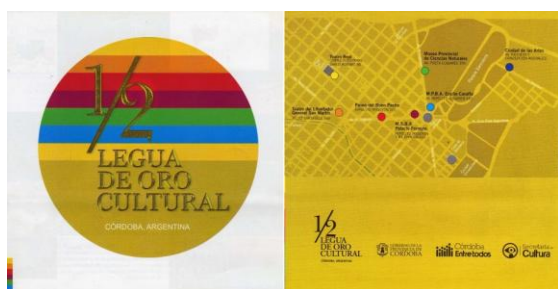
Folletería oficial sobre la Media Legua de Oro.

instituciones totalmente nuevas a partir de la remodelación y refuncionalización de edificios históricos (Paseo del Buen Pastor y MSBA); finalmente, algunas instituciones fueron trasladadas a nuevas y modernas sedes (Ciudad de las Artes y Museo Provincial de Ciencias Naturales, que se emplazó en el ex Foro de la Democracia). Todo este conjunto de obras fue inaugurado con diversas celebraciones entre abril de 2005 y diciembre de 2007. En líneas generales, podemos decir que se trató grandes obras de infraestructura realizadas a partir de una importante inversión económica. Por ejemplo, según datos obtenidos de fuentes periodísticas, en la obra del Museo E. Caraffa se realizó una ampliación de 4400 m a partir el edificio original (de 1200m 22 ), con un costo de, según declaraciones del legislador oficialista Dante Heredia, $16 millones de pesos. xxvi En el caso del Paseo del Buen Pastor, la inversión habría alcanzado los $17 millones de pesos para la construcción de un conjunto edilicio que incluye “6.000 m cubiertos de reciclaje, 3000 m 22 nuevos y un espacio verde”. xxvii