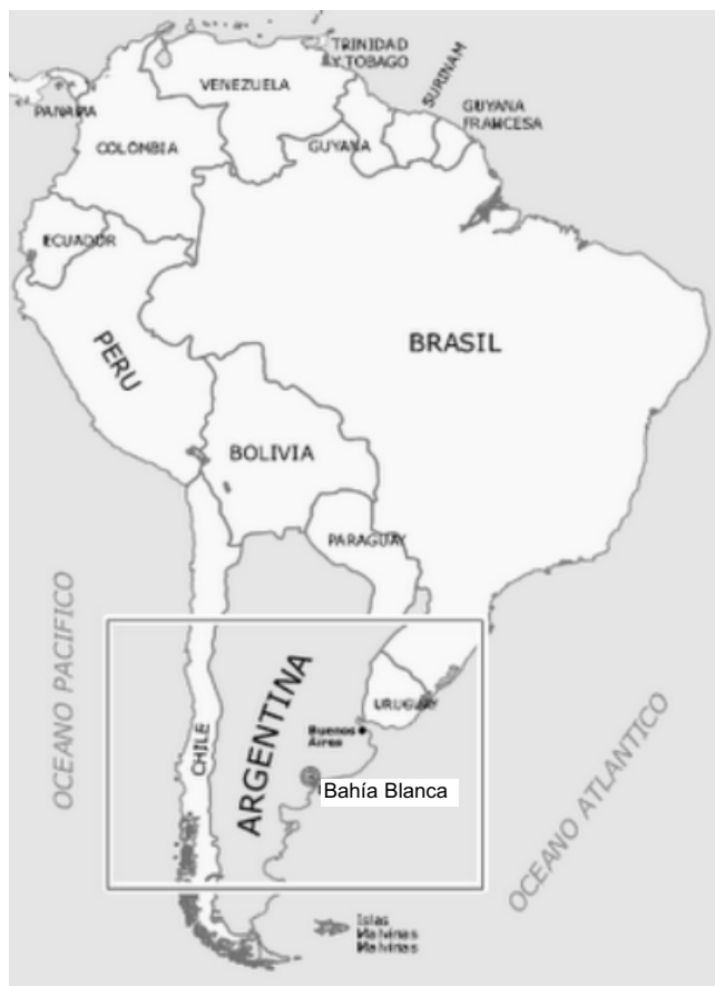
Figura N° 1. Ubicación Geográfica de Bahía Blanca