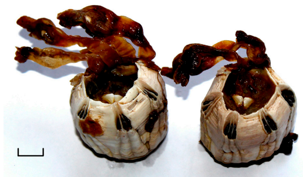
Fig. 3. Ejemplares de epibiontes coleccionados sobre Megaptera novaeangliae : Coronula diadema con hiperparasitismo de Conchoderma auritum . Escala = 10 mm.

perficie dura para su asentamiento; por ello lo hace sobre Coronula . C. auritum presenta una alta preferencia por C. diadema , lo que constituye un ejemplo de hiperparasitismo (Nilsson-Cantell, 1930; Angot, 1951). Las ballenas jorobadas no son nadadoras rápidas; esto permite a los ectoparásitos y epibiontes adherirse a su piel y permanecer allí durante toda la vida (Noad y Cato, 2007). Es probable que los epibiontes se hubieran adherido al cetáceo en algún momento de su paso por aguas costeras cálidas, con una temperatura promedio de 25-26°C (Clarke, 1966; Slijper, 1979; Félix et al., 2006). El conocimiento de la composición taxonómica, de los patrones de distribución y de la abundancia de estas especies epibiontes, representa un elemento importante para entender mejor la relación entre estos hospedadores y sus epibiontes. Además estos antecedentes permitieron, en