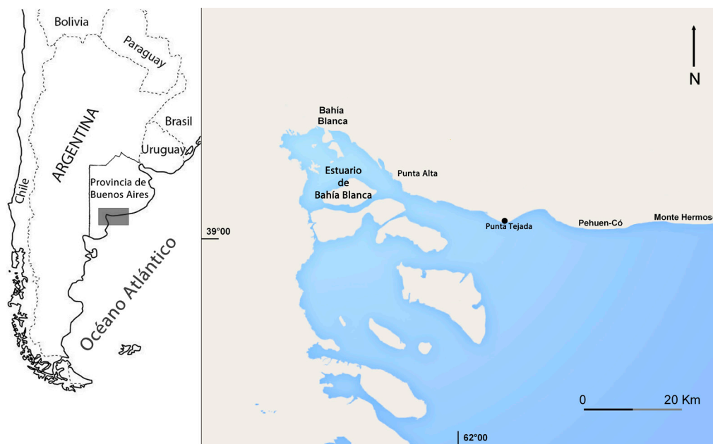
Fig. 1. Ubicación geográfica de Punta Tejada, localidad de varamiento del ejemplar de Megaptera novaeangliae reportado en esta nota (Buenos Aires, Argentina).

El ejemplar fue detectado el 22 de julio de 2011 por un pescador artesanal que informó a la Prefectura Naval Argentina indicando la presencia de una ballena varada en la costa de Playa Baterías, en el accidente geográfico Punta Tejada ( 38^{\circ}58'60''S , 61^{\circ}48'0''O ), partido de Coronel Rosales, Buenos Aires, Argentina (Fig. 1). La zona comprende un gran frente costero ocupado por instalaciones militares. Debido a la dificultad y riesgo de acceder al área, el grupo de rescatistas fue escoltado por oficiales de Policía Naval Argentina y oficiales de Infantería. Al arribar al sitio, el animal que llevaba aproximadamente 40 horas varado, se encontró muerto. Se recabó la mayor información posible del espécimen en el sitio de estudio; se tomaron medidas corporales y se recolectaron los epibiontes adheridos al cuerpo del animal. Los organismos incrustantes fueron extraídos de las aletas pectorales y caudal y conservados en etanol 70%, para su posterior identificación en el laboratorio. Los ejemplares fueron estudiados y documentados mediante una lupa Olympus SZ40, un calibre digital y una cámara fotográfica réflex Canon EOS