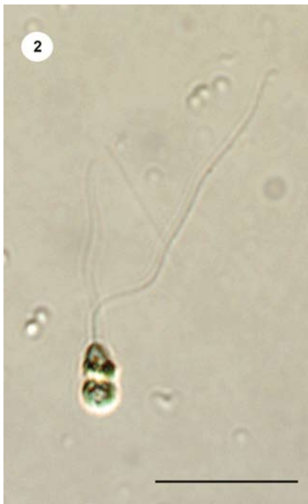
Figura 2. Aspecto general de Spermatozopsis similis al microscopio óptico. Barra escala= 10 µm.

Los ejemplares de S. similis presentaron células biflageladas fusiformes, levemente espiraladas. Su ancho varió entre 2 y 4 µm y el largo entre 2.5 y 7 µm. El extremo celular anterior fue redondeado y sin papila, mientras que el posterior resultó más angosto y finalizó en punta. La forma celular fue relativamente constante. Los 2 flagelos presentaron inserción apical y fueron desiguales en su longitud. El flagelo más largo presentó una extensión de entre 25 y 30 µm, alcanzando 5-5.5 veces la longitud celular, mientras que el corto presentó un largo de entre 10 y 15 µm, alcanzando 2-2.5 veces la longitud de la célula (Figs. 2 y 3).