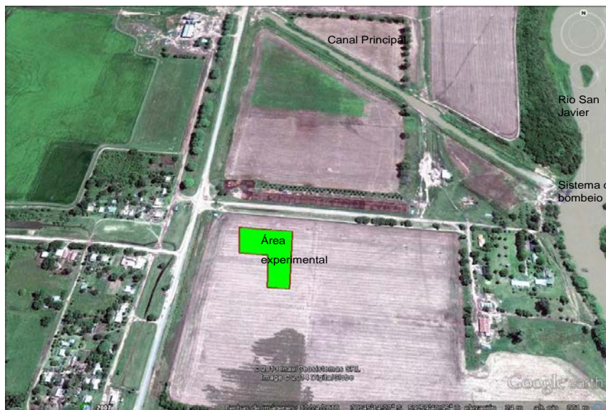
Figura 2. Detalhe área experimental no agro-ecossistema Terraço (Tç) com solo RegAb e lote sistematizado com declividade zero.

Na área dos experimentos foram realizadas as medições de infiltração com o método de duplos anéis para determinar a curva de velocidade de infiltração (VI) mediante a equação de Kostiakov. Para obter K_h_s na camada superficial do solo foram utilizados tensiôinfiltrômetros (PERROUX e WHITE, 1988), aplicando três tensões ( \tau ): 0, 1,5 e 3 cm em sitios adjacentes para o cálculo da K_h_s . Essa sequência de medições foi realizada nas duas áreas experimentais e com quatro repetições.