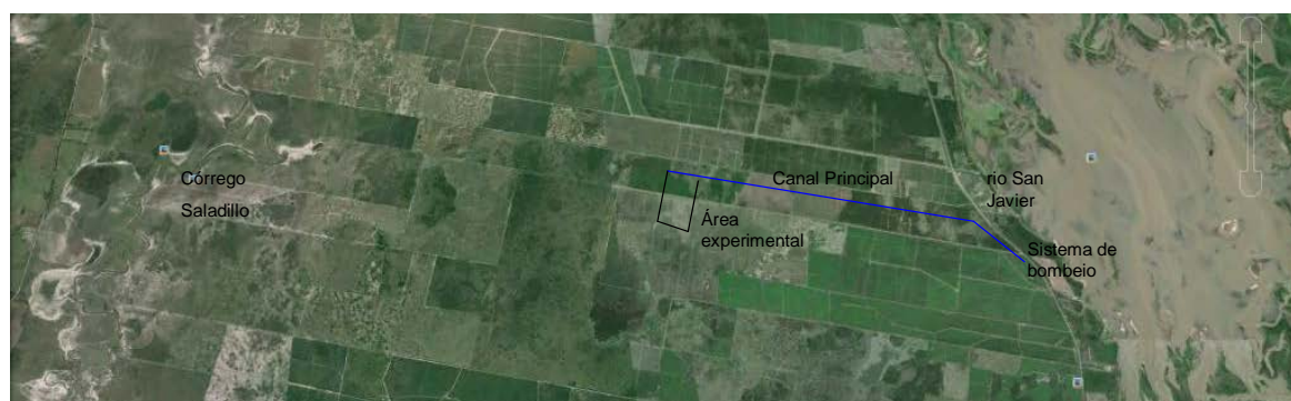
Figura 1. Agro-ecossistema Várzea (Vz) com área experimental com solo PlaNa, Río San Javier a leste e córrego Saladillo a oeste.

Nota - (1) Segundo Quintero e Figueroa (2008)