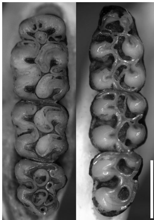
Fig. 5. Morfología oclusal de los molares de Phaenomys ferrugineus basada en el ejemplar MZUFV 3400, de izquierda a derecha: serie molar superior y serie molar inferior, ambas izquierdas. Escala = 2 mm.

Los incisivos son muy robustos, opistodontes y con fisura en la dentina recta y corta (cf. Steppan, 1995). Los molares (Fig. 5) son braquiodontes y crestados, al menos en la condición de subadulto del MZUFV 3400 (contra la tipificación de aterrizados que dan Bonvicino et al., 2001). Las cúspides principales son opuestas, tanto en el M1 como en el m1, con una alternancia creciente en los M2/m2 y M3/m3. Tanto los molares superiores como los inferiores muestran sus flexos/idos linguales/labiales cerrados por un cingulo filoso de esmalte; mientras que en los superiores este cordón perimetral no parece tener engrosamientos, eliminando la posibilidad de confusión con enterostilos o protostilos, en los inferiores hay un leve abultamiento a nivel del hipofléxido, que