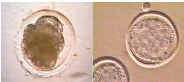
Figura 3. Embriones de búfala producidos por fertilización in vitro luego de la maduración de ovocitos durante el transporte de 18 horas.