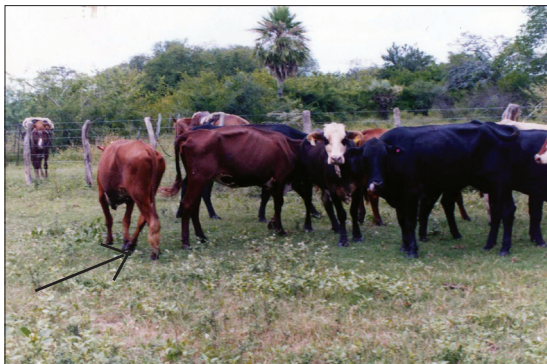
Figura 1. Rodeo de bovinos infectados con Trypanosoma vivax . La flecha señala un animal con evidentes trastornos locomotores del tren posterior. Obsérvese el deteriorado estado de salud de los animales.

Las características clínicas de un rodeo de bovinos infectado con T. vivax en Formosa se muestra en la Figura 1. Muestras de sangre de estos animales en observaciones microscópicas de gota fresca revelaron los típicos movimientos