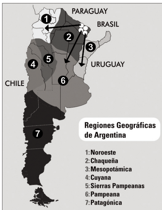
Figura 3. Zona enzoótica para T. vivax en Argentina. Los círculos indican áreas donde ocurrieron brotes de tripanosomosis bovina por T. vivax , en Formosa, Provincia ubicada en la Región Chaqueña. Las flechas señalan las regiones ganaderas a las cuales podría extenderse la enfermedad.

El T. vivax fue reportado por primera vez en Brasil en las proximidades de la ciudad de Belém en 1972 (Shaw y Lainson); veinticinco años más tarde se lo detecta en la región del Pantanal produciendo elevada mortandad en rodeos de bovinos (Silva et al , 1998 a, b). Once años más tarde llega a la Argentina (Monzón et al , 2008), iniciando la epizootia reportada en este trabajo. La enfermedad en Formosa se extendió rápidamente en los búfalos (Monzón et al , 2011) y en menor medida en caprinos y ovinos (Mancebo O. A. no publicado). En forma simultánea ocurría la notable expansión de este tripanosoma en el vecino país de Brasil; en pequeños rumiantes (Batista et al , 2009), en bovinos de carne (Batista et al , 2008), de leche (Cadioli et al , 2012) y también en equinos (Da Silva et al , 20011). T. vivax emergió en Sao Pablo 13 años después de haberse detectado los primeros brotes en la zona del Pantanal ocurrido en 1995. (Cadioli F. A. et al , 2012; Silva et al , 1998) Si bien actualmente