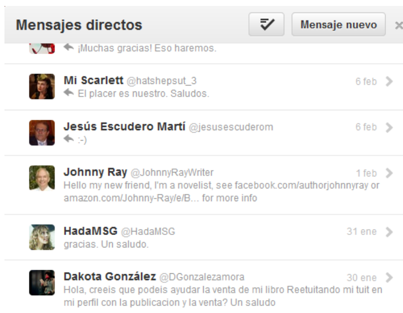
Figuras 7a y 7b. Mensajes directos (todos pertenecientes a 2013).

Con todo, y a la vista de las figuras 5-7(a, b), se comprueba que existe complicidad entre los interlocutores, que se tutean saludándose de modo familiar y no se sienten desvirtualizados, presentando una imagen de afiliación común. No existe -no se necesita- negociación de turnos ni cooperación, frente a lo que autores como Escavy (2009: 107) aprecian para sistemas de comunicación semejantes como el chat y cualquier mensajería instantánea. Lejos de hallarse descortesía, provocación o ataque a la imagen, las intervenciones matizan o complementan los tuits ofrecidos, sin olvidar el agradecimiento. No puede hablarse de “ruido” conversacional, presente a través de