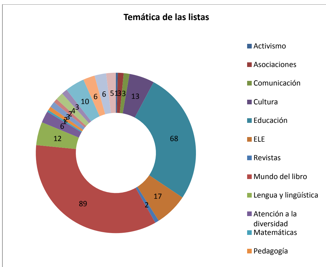
Fig. 3. Distribución de las listas por áreas temáticas

Por lo que atañe a las listas, a fecha de 30 de agosto de 2013, 12:05h, @ComprensLectora aparece suscrita a 229 listas y como miembro en 231, de las que 204 coinciden y que arrojan un total de 256. Estar informado de las listas o ser miembro de ellas persiguen un mismo fin de aprendizaje. Por otro lado, los usuarios no se limitan a confeccionar una sola lista 3 . Su temática, lógicamente, no admite taxonomía rígida. Unas listas son más generales, otras más específicas, unas son monotemáticas y otras heterotemáticas, que focalizan su atención en un determinado tema, sin excluir otros.