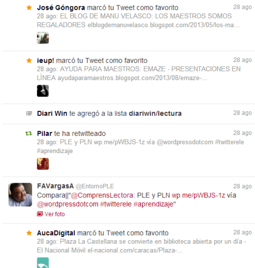
Fig. 5. Mensajes públicos. 3/09/2013, 20:01h

La interacción tiene lugar sobre todo mediante mensajes públicos, que consisten en peticiones de información, marcado de favoritos, inclusión en listas y retuits literales o reelaborados, estos últimos con mecanismos citativos: