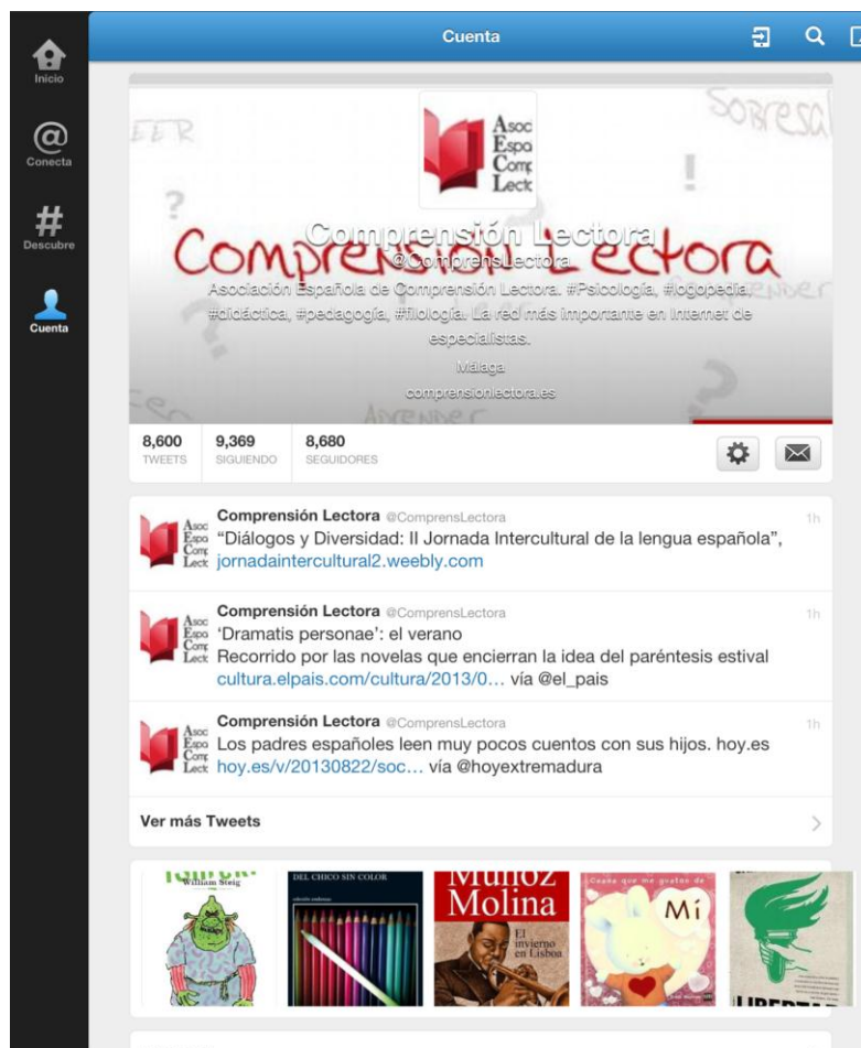
Fig. 2. Interfaz de @ComprensLectora, versión IPAD, 30/08/2013, 01:34

necesariamente interdisciplinar, que aúna filología, logopedia, psicología y didáctica, agrupadas con un propósito común: (enseñar a) entrenar la competencia lectora mediante el fomento de la lectura. Esta cuenta, además, ha conocido una importante consolidación, como veremos en el siguiente apartado, en un relativamente corto periodo de tiempo, desde su creación el 12 de abril de 2011: