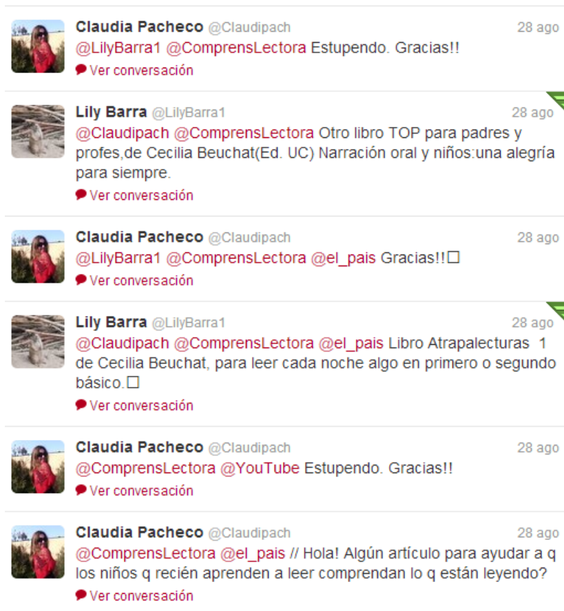
Figura 6. Diálogos 3/09/2013, 20:02h

En cuanto a los mensajes directos, son sobre todo agradecimientos (y petición de seguimiento mutuo), y, en menor proporción, invitaciones a seguir páginas, participar en eventos o preguntar por recursos. Reflejan también el intercambio, aunque su número es sensiblemente inferior a las interacciones públicas. A ello puede haber contribuido la concepción eminentemente pública de la red social, pero, además, el hecho de que estos mensajes pueden configurarse automáticamente (el caso de @JohnnyRayWriter, por ejemplo, en la figura 7b), impersonalidad que no bien admitida por los usuarios; y, lo que es más peligroso, suponen un medio poco deseable de introducción de virus.